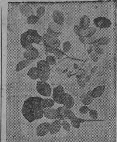
Uno de los trabajos presentados

Uno de los más vivos deseos del profesor Guinea, y el cual es acompañado por una alta jerarquía de la Palange, a la vez gran escritor de esta hora, es hacer llegar a los