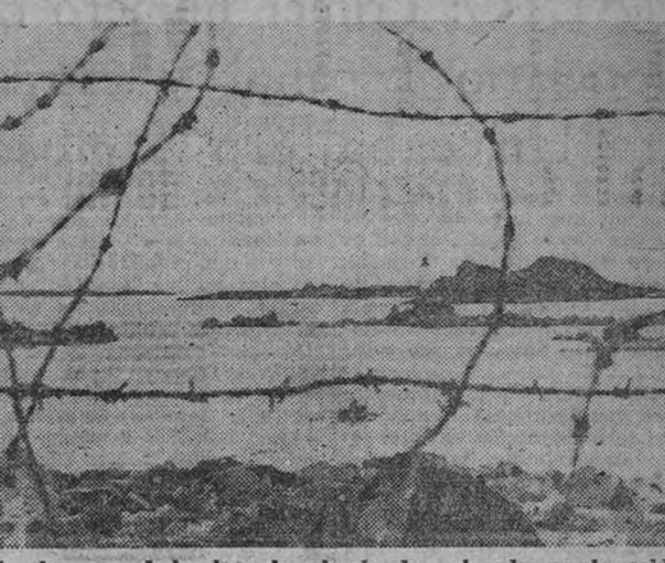
Sobre las rocas de la playa, las alambradas colocadas por los soldados alemanes ponen una nota bélica sobre la escena apacible que ofrece el faro frente a la serenidad del mar, en la costa norte de Francia.