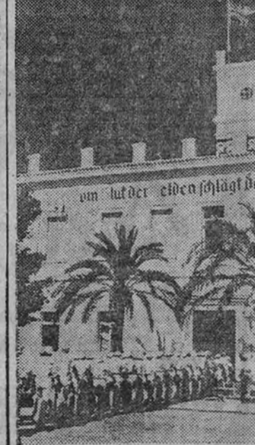
En un antiguo castillo, en la playa del Mediterráneo, ha sido instalada una Escuela de Marina alemana. Marineros jóvenes son instruidos para sus misiones en el Sudeste. Vista del edificio principal de la Escuela