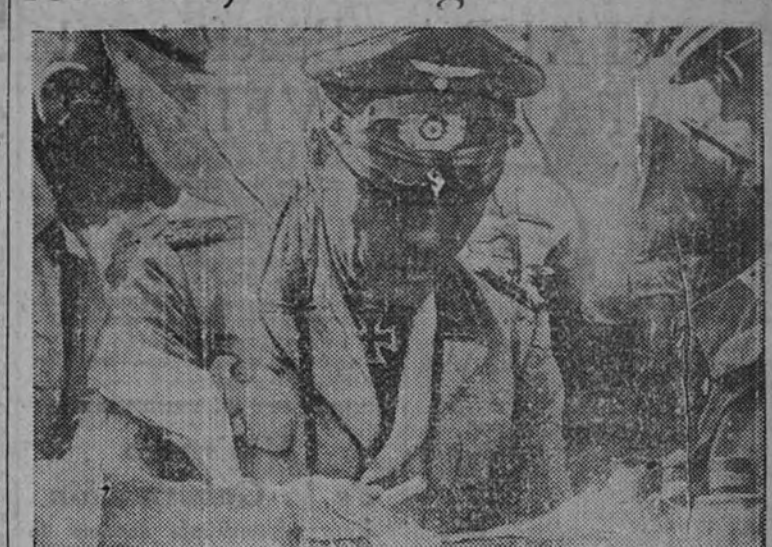
Una de las últimas fotografías obtenidas del mariscal general Rommel durante una de sus conversaciones con su Estado Mayor en el desierto, en la presente etapa de las operaciones de África del Norte