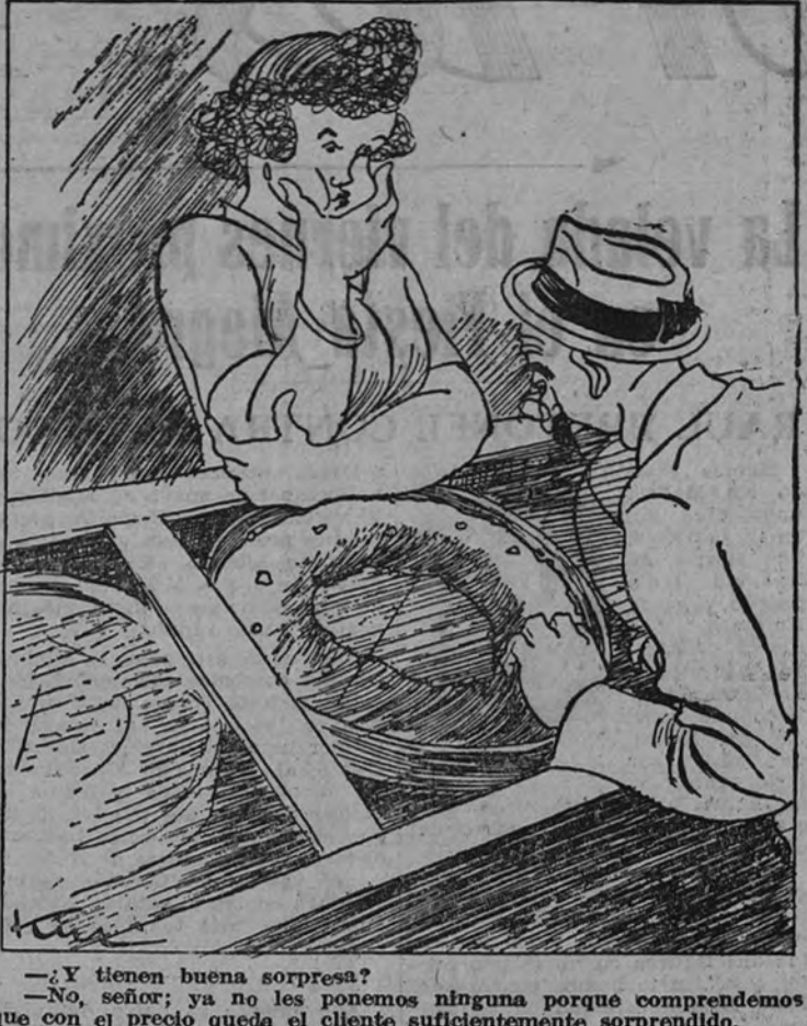
—¿Y tienen buena sorpresa? —No, señor; ya no los tenemos ninguna porque comprendemos que con el precio queda el cliente suficientemente sorprendido.

El ministro de Justicia, don Esteban Bilbao, preside mañana la reunión de la Junta del Patronato de Protección a la Mujer.