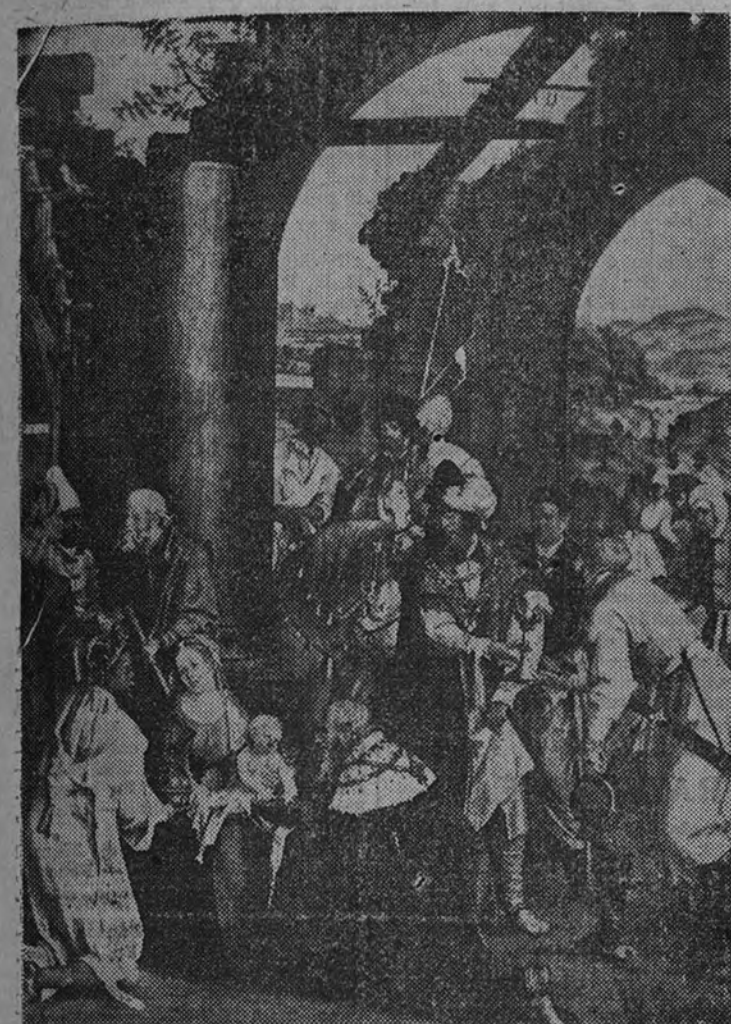
La Adoración de los Reyes Magos ha sido tema de máxima inspiración para los artistas. He aquí el célebre cuadro de Hans v. Kulmbach (siglo XVI), que se conserva en el Kaiser Friedrich-Museum, de Berlín