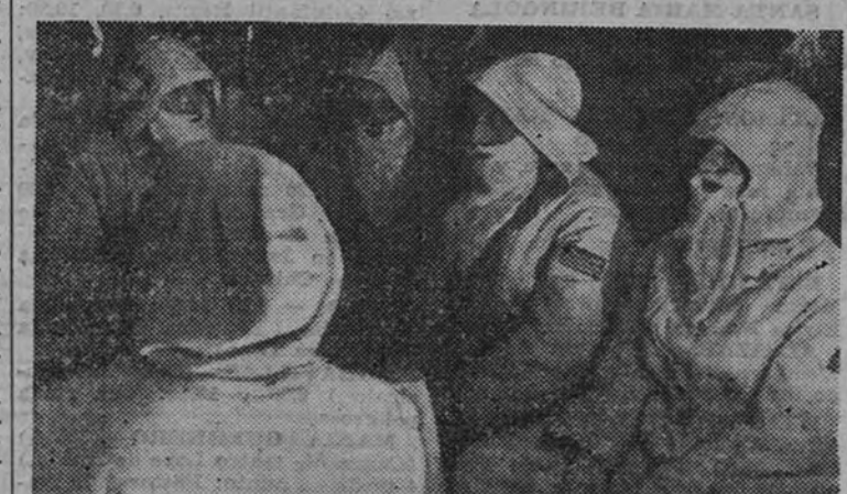
Varios papás noes, entre los soldados del lago Ilmen, esperan la orden de partir, no contra los objetivos enemigos, sino a efectuar el reparto de obsequios a los soldados