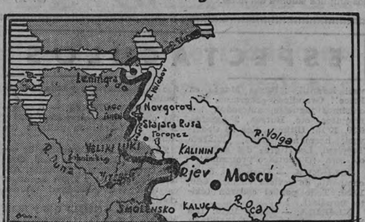
Un gráfico del sector del Este donde se desarrolla más intensa actividad bélica en estos días

GRAN CUARTEL GENERAL DEL FUHRER 5.—Comunicado del Alto Mando de las fuerzas armadas alemanas: "Al oeste del Cáucaso ha sido tomado por asalto un punto de apoyo enemigo en el curso de un ataque sorpresa. Aviones de bombardeo han atacado el puerto de Gedeledzhik y sus instalaciones y han dispersado los transportes por la carretera costera. Los ataques enemigos al sur del lago Ilmen y los ataques aliados de pequeños grupos enemigos cerca de Krasnodar han sido rechazados." En la región del Don continúan los intensos combates defensivos. En el sector central del frente los soviets han perdido cuatro tanques en el curso de los combates sostenidos en torno a Veliki-Luki. Los ataques lanzados por la infantería enemiga al sur del lago Ilmen y los ataques aliados de pequeños grupos enemigos cerca de Krasnodar han sido rechazados." También han fracasado los intentos de ataque del enemigo en el sector del Volchov y frente a Leningrado. En Kandaishka han fracasado los ataques del enemigo, que ha perdido gran cantidad de material de guerra. Un batallón de cazadores soviéticos ha sido cercado y aniquilado." (Efe.)