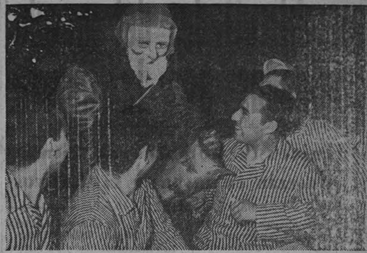
Varios heridos de la temida División española reciben en el hospital de Navidad los regalos que les hace Papá Noel