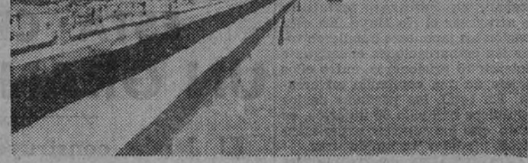
El pantano de San Bartolomé, en Ejea de los Caballeros, recientemente inaugurado por el Caudillo

El canal bajo del Guadalquivir, adjudicado a las Colonias Penitenciarias Militares, va siendo brillantemente desarrollado en una veintena de kilómetros, restando ultimar cinco kilómetros, y el acueducto de San Juan, también a cargo de las Colonias Militares, para, mediante elevación de agua, poner en riego otras 6.000 hectáreas.