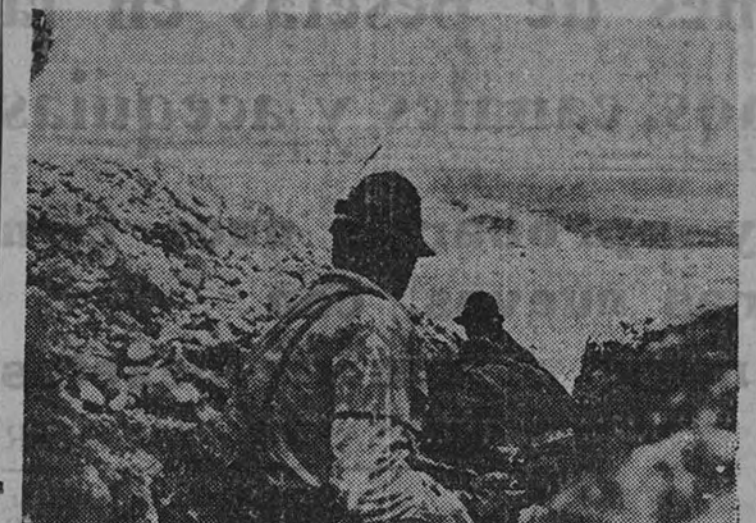
Desde estas posiciones avanzadas, el Cuerpo de Apinistas Italianos domina el valle del Don en todas las direcciones de las que pueda partir un ataque soviético