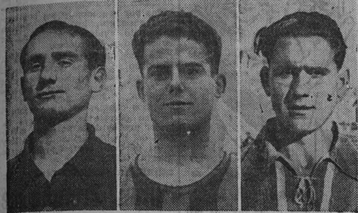
En el equipo modesto, Cuenca, Sacristán y Grande formaron una línea media llena de efectividad

La escuela castellana de fútbol tiene continuadores en los equipos regionales