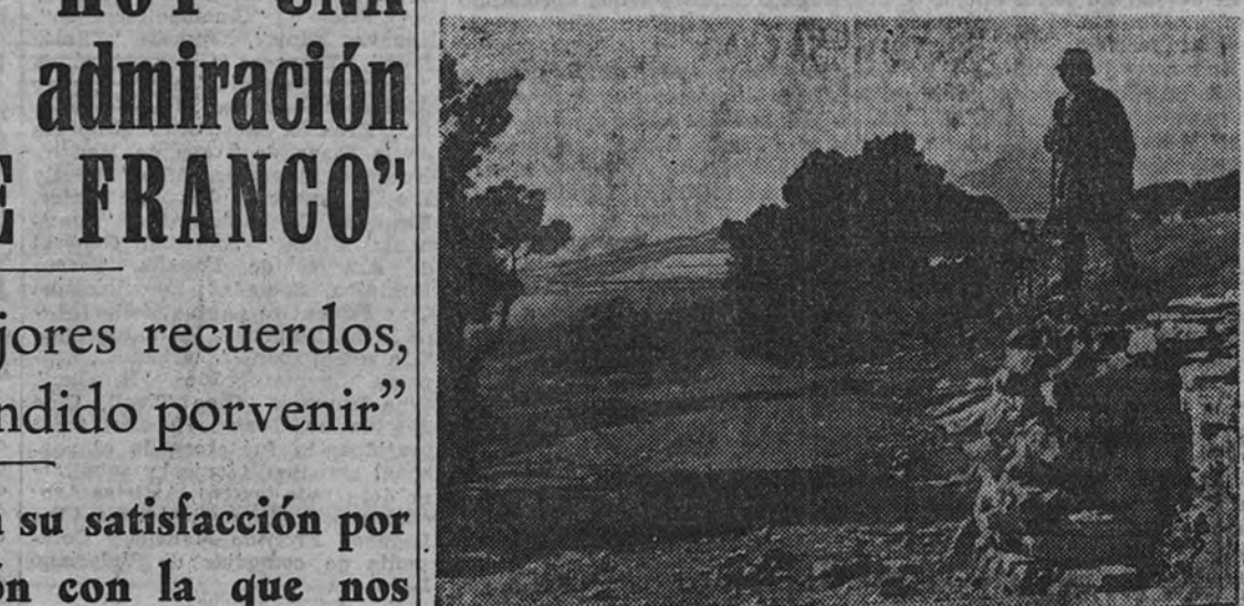
El contingente alemán ha ocupado su posición sobre un puerto de la Francia meridional y desde allí vigila el litoral bañado del Mediterráneo