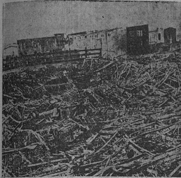
Las instalaciones de la gran fábrica de tractores ofrecen hoy este desolador aspecto