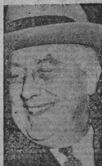
1941 y diez veces más que en la guerra mundial. Creo que el arsenal de las democracias ha demostrado su eficacia."

WASHINGTON 7.—El Presidente Roosevelt comenzó la lectura de su mensaje anual al Congreso a las 8.30 horas de la tarde. Empezó diciendo que el año 1943 se caracterizará por conflictos violentos, pero que, sin embargo, constituirá una promesa de acontecimientos mejores. "Cada día que pasa disminuye la potencia naval y aérea japonesa, y aumenta la norteamericana. El pueblo nipón se dará cuenta de la verdad cuando empecemos a bombardear constantemente sus islas metropolitanas." El Presidente prometió que China recibirá el material bélico necesario para vencer al "enemigo común." "En 1942 produjimos 670.000 ametralladoras, seis veces y media más que nuestra producción que participamos en la primera guerra mundial. Produjimos 21.000 cañones antitanques, seis veces más que lo fabricado en 1917. Produjimos 10.250.000.000 de cartuchos, es decir, cinco veces más que en 1917 y tres veces más que en la primera guerra mundial. Produjimos 181 millones de botones, doce veces más que en