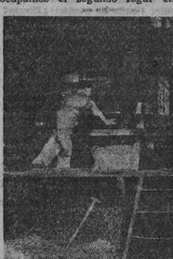
Obreros de una fábrica española de corcho aglomerado dando forma y solidez a las plantas de esta nueva materia plástica

reas: España, 450.000; Argelia, 445.000; Marruecos, 350.000; Túnez, 170.000; Francia, 150.000, e Italia, Cerdeña y Grecia, 100.000 en total. Es decir, que España ocupa el segundo lugar del espacio plantado de alcornoques. Y si a este hecho añadimos que también ocupamos el segundo lugar en