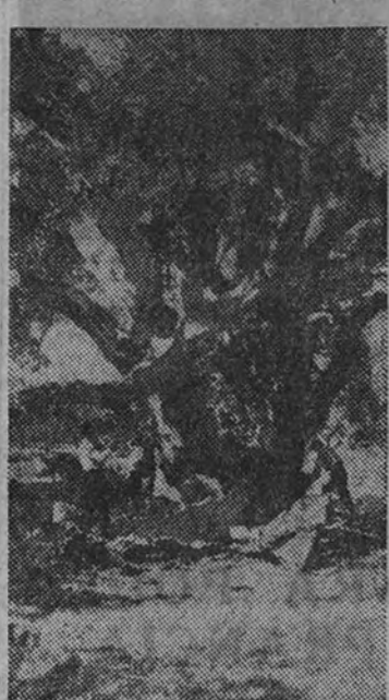
Labor de descortezado de un alcornoque en una plantación de Andalucía

El corcho no es otra cosa que la propia corteza del alcornoque, extraída y sometida a determinados tratamientos. Este árbol, vetusto y sobrio, se produce únicamente en la Península Ibérica, Francia, Argelia, Marruecos, Italia y Cerdeña, aparte de pequeñas cantidades correspondientes a Túnez y Grecia. El alcornoque es, por consiguiente, una especie autóctona exclusiva de las tierras secas y soleadas del Mediterráneo occidental. Se ha intentado acclimatarse a otras regiones con trasplantes de alcornoques jóvenes, pero con escaso éxito, desde el punto de vista económico. Según las estadísticas más serias, las superficies ocupadas por el alcornoque son las siguientes: Portugal, 555.000 hectá-