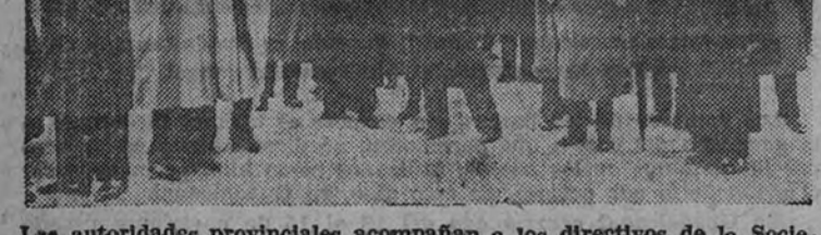
Las autoridades provinciales acompañan a los directivos de la Sociedad Anónima Echevarría, en la ceremonia de inauguración.

Tba a caer la última hoja del calendario siderúrgico vizcaíno, y una empresa empeñada arduamente, con celo escrupuloso y con la más vieja solera de productora de esta tierra, fecunda de iniciativas y generosa en el quehacer nacional—la que un colapso del tiempo pareció dar fisionomía distinta a su inquebrantable adhesión a España—, daba fin a su anual tarea con un acto de trascendental emotividad en el campo técnico de la siderurgia.