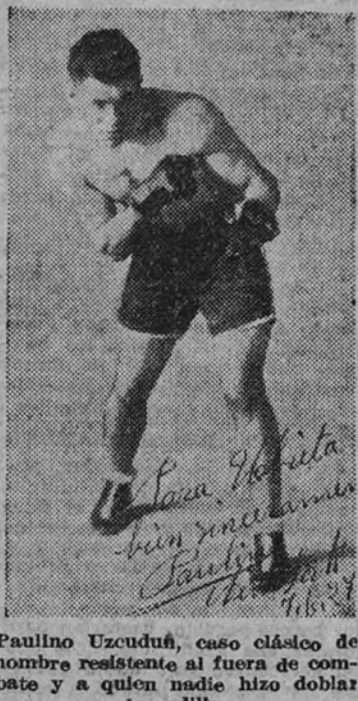
Paulino Uzcudun, caso clásico de hombre resistente al fuera de combate y a quien nadie hizo doblar la rodilla