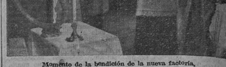
Momento de la bendición de la nueva factoría.

(El número total de beneficiarios actualmente es el 70 por 100 de los 2.215 que forman la cadena de trabajo de esta Empresa, y lo que hace esperar que en un tiempo inmediato la Mutualidad comprenderá a cuantos en ella trabajan.)