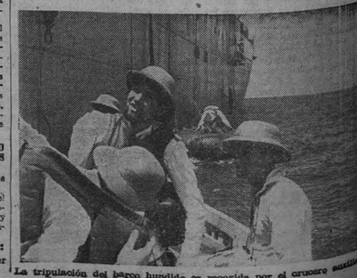
La tripulación del barco hundido se rescató por el crucero español.