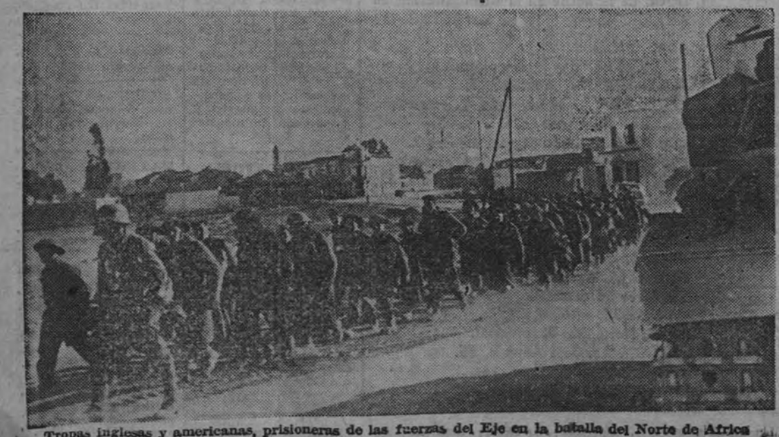
Tropas inglesas y americanas, prisioneras de las fuerzas del Eje en la batalla del Norte de África.