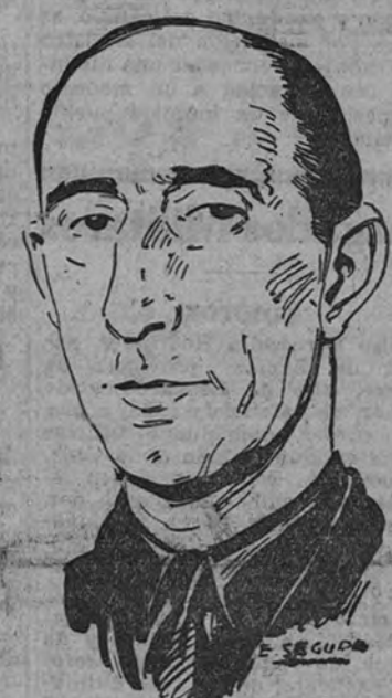
Discurso de Mora Figueroa

El Vicesecretario General del Movimiento impondrá hoy en Coruña las Medallas de Vieja Guardia