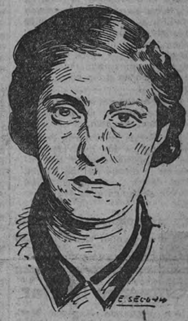
Discurso de Pilar Primo de Rivera

“Camaradas: El continuo caminar por tierras de España nos ha traído este año a Santiago de Compostela. Será casualidad o será que este año santo de 1943 tiene el signo de la primacía de los valores morales y Dios ha querido que cobijemos nuestros proyectos bajo la sombra del Apóstol?”