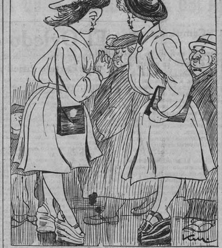
—Pero dónde vamos a llegar?