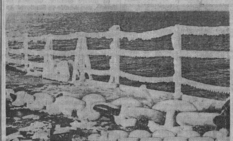
Con nieve sobre su cubierta, el crucero alemán mantiene su constante vigilancia por las aguas de los mares del Norte