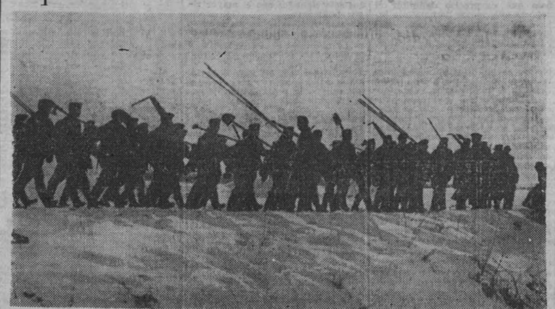
Una sección de esquiladores del Ejército alemán se dirige hacia el frente en uno de los sectores del Norte

Esquiadores alemanes en marcha hacia el frente