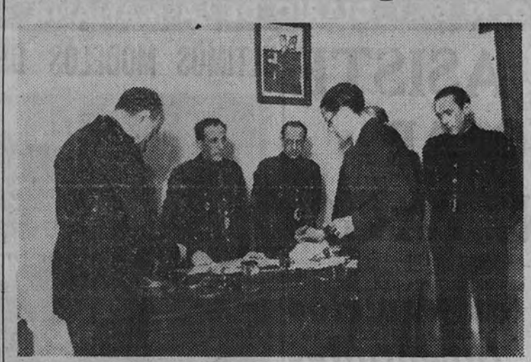
Un momento de la entrega de los premios.

A las seis de la tarde de ayer tuvo lugar en el Sindicato Nacional del Espectáculo la entrega de los diez premios de 25.000 pesetas a los autores de los guiones premiados.