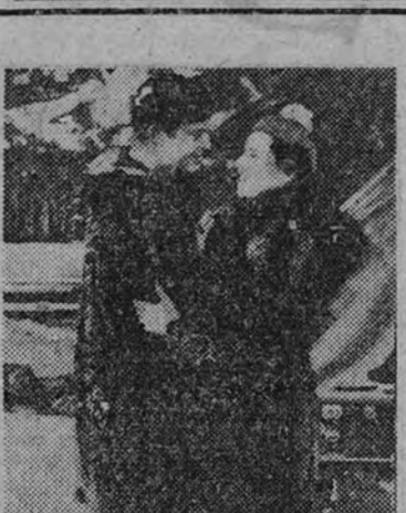
"Al servicio del deber" tiene como protagonistas a Chester Morris y Jane Wyatt, que aparecen en esta fotografía.