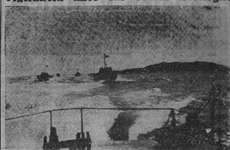
Barcos patrulleros del Reich mantienen constante vigilancia frente a las costas noruegas, en previsión de cualquier ataque enemigo