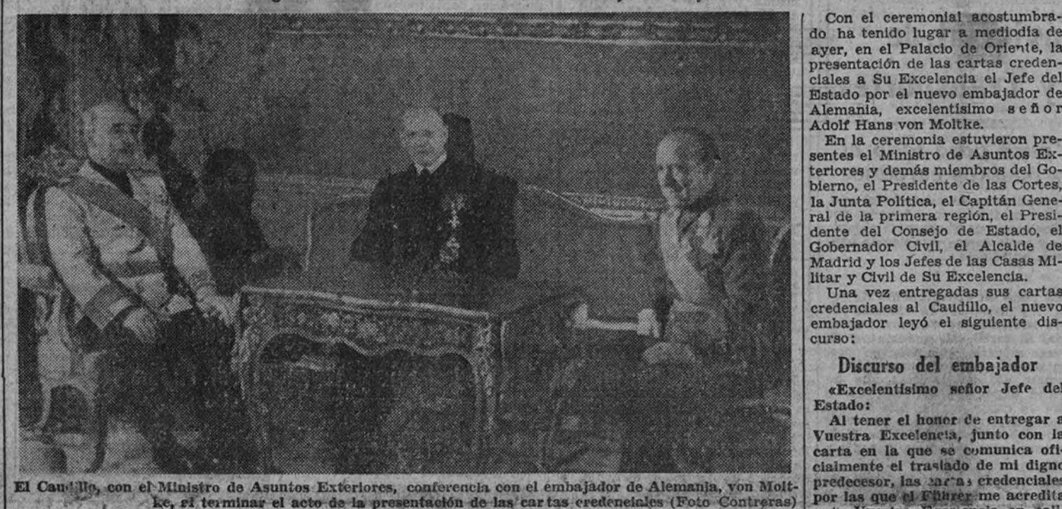
El Caudillo, con el Ministro de Asuntos Exteriores, conferencia con el embajador de Alemania, von Moltke, al terminar el acto de la presentación de las cartas credenciales

"Nuestra nación se enorgullece de que sangre española se derrame junto a la vuestra", responde el Caudillo