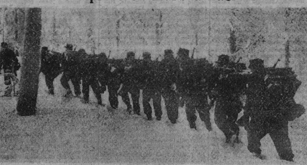
Una sección finlandesa de cazadores alpinos marcha sobre la nieve hacia las posiciones avanzadas

Cazadores alpinos en marcha hacia el frente