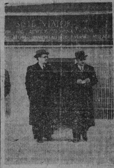
El Ministro de Educación Nacional visita los edificios de la Ciudad Universitaria, acompañado del rector.