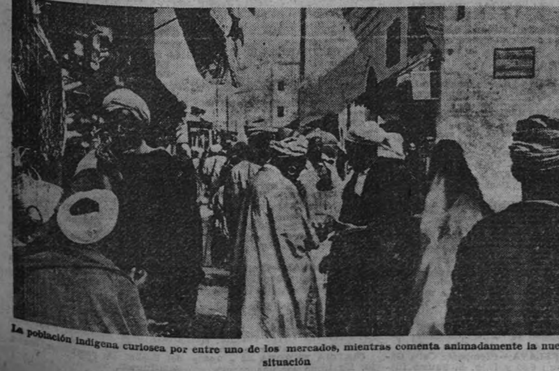
La población indígena curiosa por entre uno de los mercados, mientras comenta animadamente la nueva situación