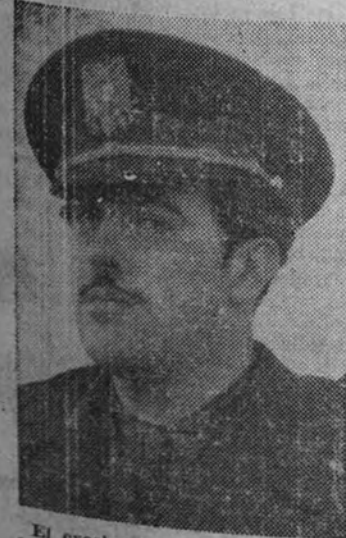
El excelentísimo señor Ministro de Trabajo, camarada José Antonio Girón de Velasco, que regresó a Madrid procedente de Barcelona, en el salón de actos del Ministerio de Trabajo.

El camarada Girón dará una conferencia sobre "Consignas políticas"