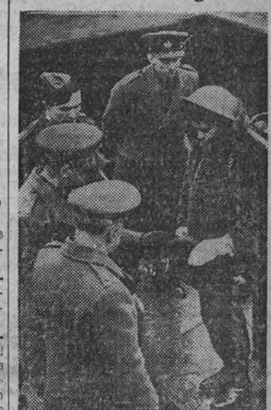
Los generales Sir Frederick A. Pile y Sir Riddell Webster, inspeccionando una sección de las mujeres combatientes inglesas, vestidas con uniforme de invierno.