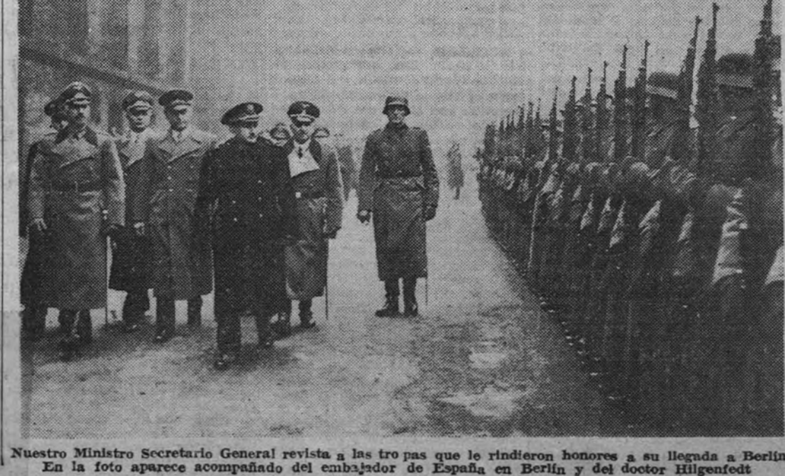
Nuestro Ministro Secretario General revisa a las tropas que le rindieron honores a su llegada a Berlín. En la foto aparece acompañado del embajador de España en Berlín y del doctor Hilgenfeldt.