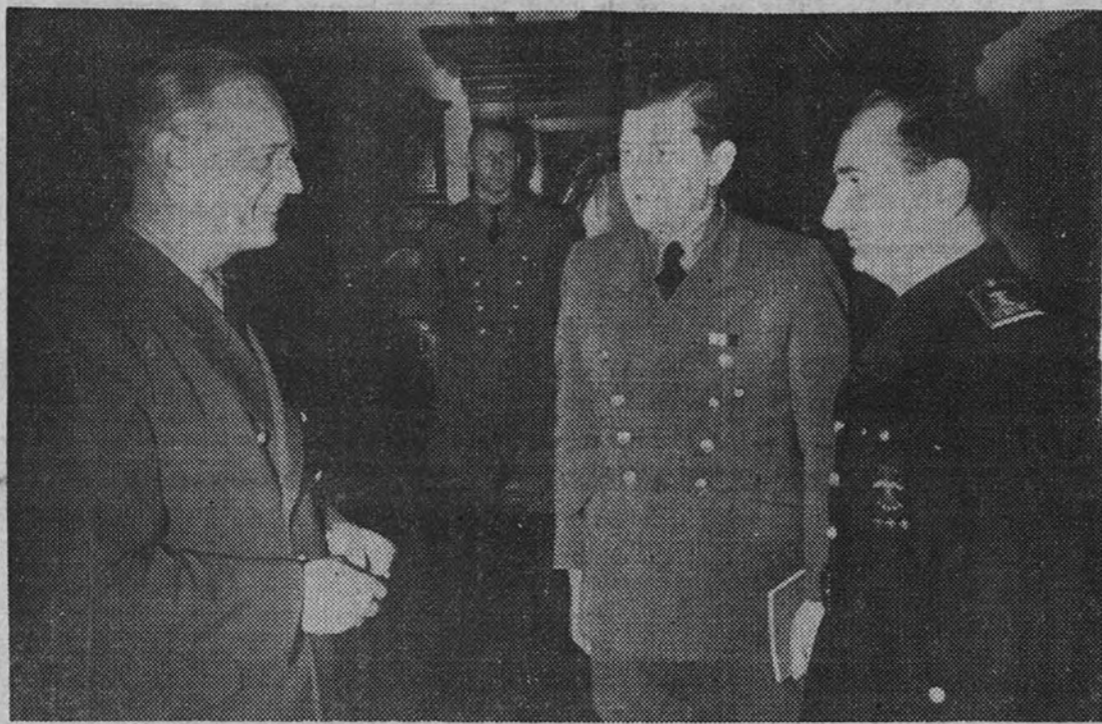
Nuestro Ministro Secretario General se entrevistó durante su estancia en Berlín con el ministro de Asuntos Exteriores del Reich, von Ribbentrop. La foto nos muestra un momento de la conversación entre los dos estadistas.

Ayer tarde llegó a Madrid el Ministro Secretario General del Partido, camarada Arrese, de regreso de su viaje por Alemania.