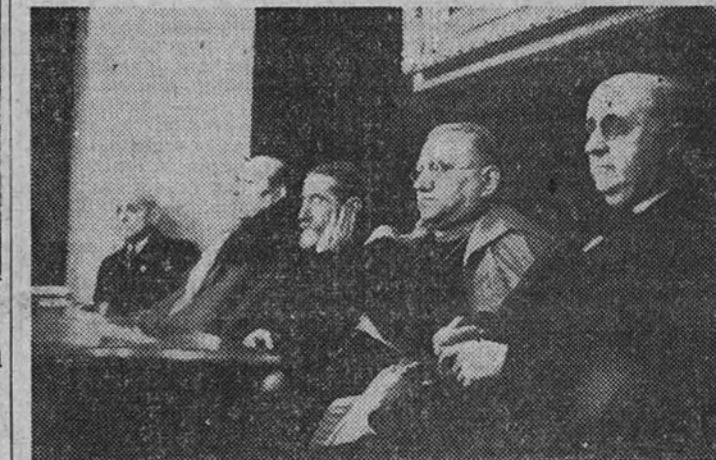
El Nuncio de Su Santidad, en la presidencia del acto

Presidió el Nuncio Apostólico y concurrieron numerosas personalidades