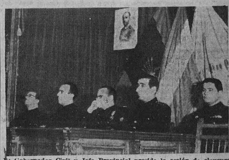
El Gobernador Civil y Jefe Provincial preside la sesión de clausura del Consejo Provincial del S. E. M.

A las siete de la tarde de ayer, en la Delegación Provincial de Educación, se celebró el solemne acto de clausura del Primer Consejo Provincial del S. E. M. de Madrid.