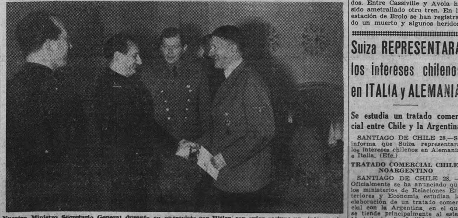
Nuestro Ministro Secretario General durante su entrevista con Hitler, con quien sostuvo una interesante conversación

La entrevista del Führer con el camarada Arrese