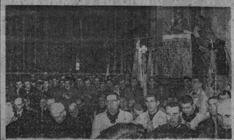
El obispo de Madrid-Alcalá en el solemne acto de consagración de la diócesis al Corazón de María

El acto, presidido por las autoridades, constituyó una fervorosa manifestación de fe