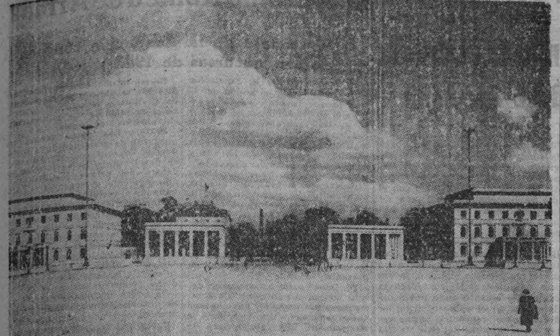
La Plaza Real de Munich, con la casa del Führer, la Administración del Partido y los dos «Templos de Honor», en los que reposan los restos de los primeros dieciséis caídos del Nacionalismo

La historia del nacionalsocialismo desde su nacimiento y a través de los crecientes avatares de su lucha dramática ha quedado ya siempre sujeta a la plaza de las calles y de las plazas de Munich, ya para siempre está allí, orgullosamente apostada en la plaza de la Feldherhalle, donde cayeron los primeros camiónes, y gloriosamente proclamada para la eternidad desde la monumental arquitectura de la Feldherhalle, donde aquellos adalides del heroísmo reposan bajo el bronce. Munich es la ciudad donde creció la obstinada esperanza de una Alemania grande, recuadrada para su histórico destino, y la ciudad que mantiene viva la memoria de aquellas trágicas jornadas en las que la Patria traidora se ponía de nuevo en pie, a golpes de corazón, levantada sobre los hombros de Adolf Hitler. Desde la Bürgerbräu, donde nació el Movimiento Nacional-socialista, hasta los gigantescos edificios que constituyen la sede actual del Partido, en cada esquina de Munich resuena aún, como permanente eco glorioso, el paso militar de los batallones del Führer pidiendo la calle abierta para su marcha.