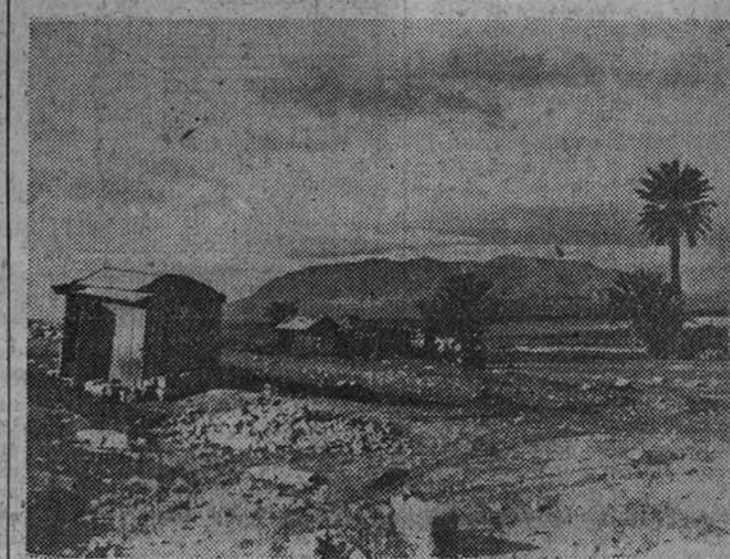
Un punto de apoyo inglés ocupado por las tropas alemanas en Túnez. Al fondo, un tanque británico destruido