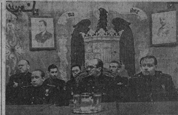
El Ministro de Educación Nacional, con las jerarquías que han formado la presidencia en el acto inaugural del I Consejo Nacional del S. E. M.