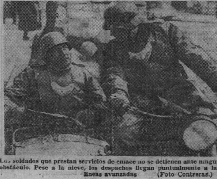
Los soldados que prestan servicios de enlace no se detienen ante ningún obstáculo. Pese a la nieve, los despachos llegan puntualmente a las líneas avanzadas.