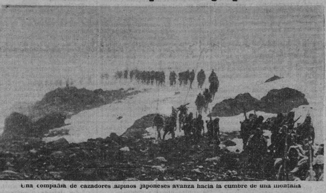
Una compañía de cazadores alpinos japoneses avanza hacia la cumbre de una montaña