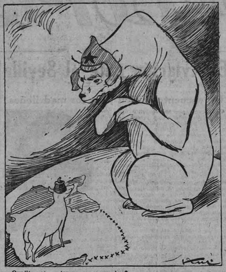
—Ovejita, ¿te quieres casar conmigo?