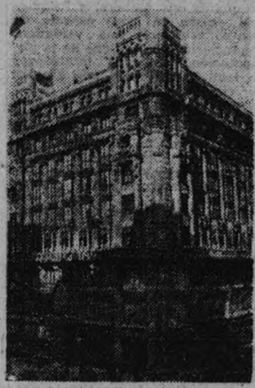
Banco Mercantil e Industrial

La fachada del Banco Mercantil e Industrial