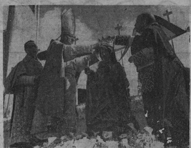
El Nuncio de Su Santidad en el emocionante acto de coronar a la imagen de la Virgen