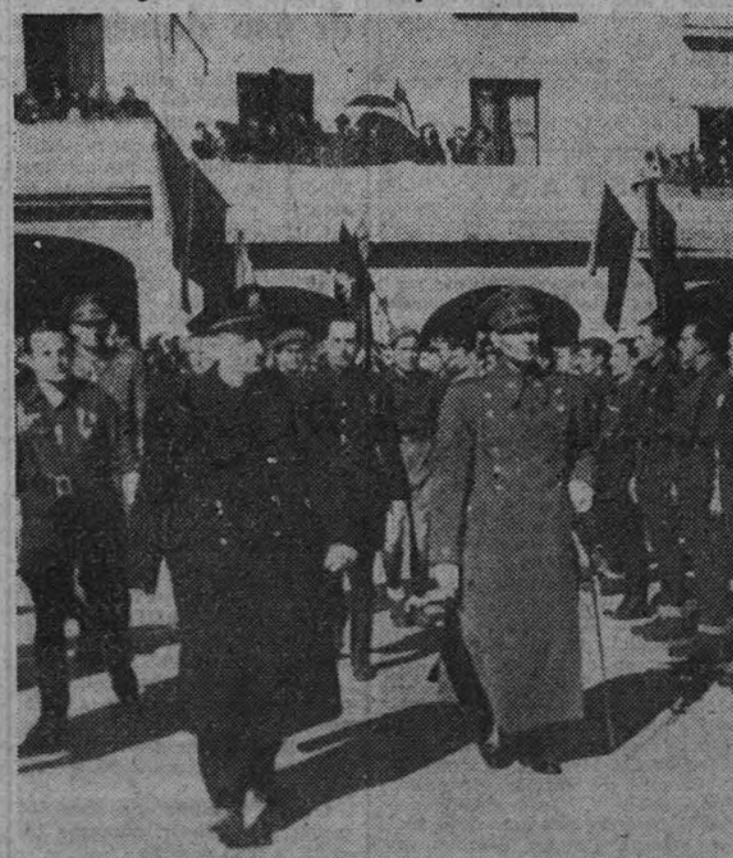
El Ministro Secretario General del Partido, camarada Arrese, en compañía del Jefe Provincial de Cáceres, pasa revista a la formación de la Falange, durante su estancia en la capital extremeña