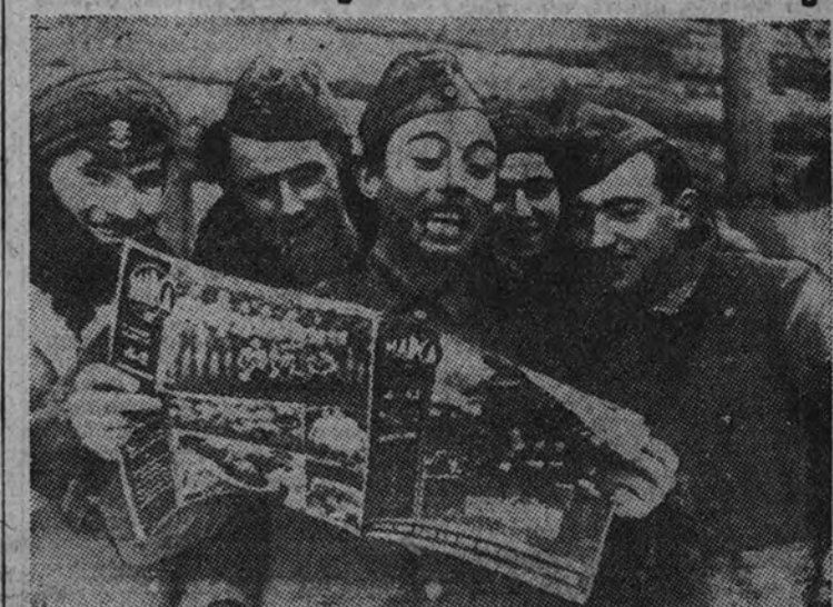
Ausentes de los campos de fútbol, por cumplir un sagrado deber nacional, los voluntarios de la División Azul siguen animadamente las incidencias de la Liga. "Marca" lleva la alegría a frente, máxime cuando resulta triunfante en los encuentros los equipos favoritos

La División Azul sigue las incidencias de la Liga