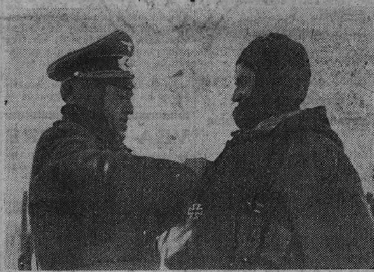
Los marinos del "Juan Sebastián Elcano" visitan Puerto Cruz

BERLIN 12.—Los numerosos contraataques de las tropas alemanas, y aliados, que se han sucedido en parte, en el sector sur del frente oriental, con notables ganancias territoriales, muchos