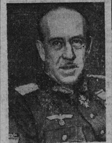
General don Esteban Infantes, jefe de la División Azul española, que ha sido condecorado recientemente por el Fuhrer

Las pérdidas japonesas son las siguientes: Un acorazado, un portaavión, dos cruceros, seis destructores, cinco submarinos y un petrolero. Cuatrocientos sesenta y seis aviones se precipitaron voluntariamente contra sus objetivos o se consideraron como desaparecidos, y 145 aparatos resultaron gravemente averiados. (Efe.)