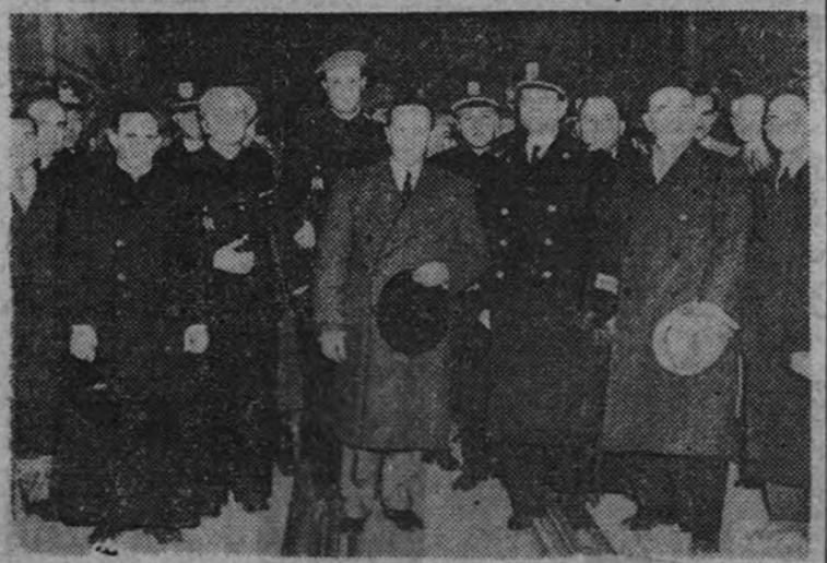
El nuevo embajador de España en el Quirinal, camarada Raimundo Fernández Cuesta, en el momento de su llegada a Roma