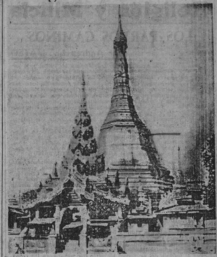
Recientemente, y en una incursión de los aviones ingleses, la Pagoda de Oro de Rangún ha resultado destruída al ser alcanzada por el bombardeo. La foto nos muestra un aspecto de cómo era la bellísima pagoda, uno de los templos más admirables de Birmania.