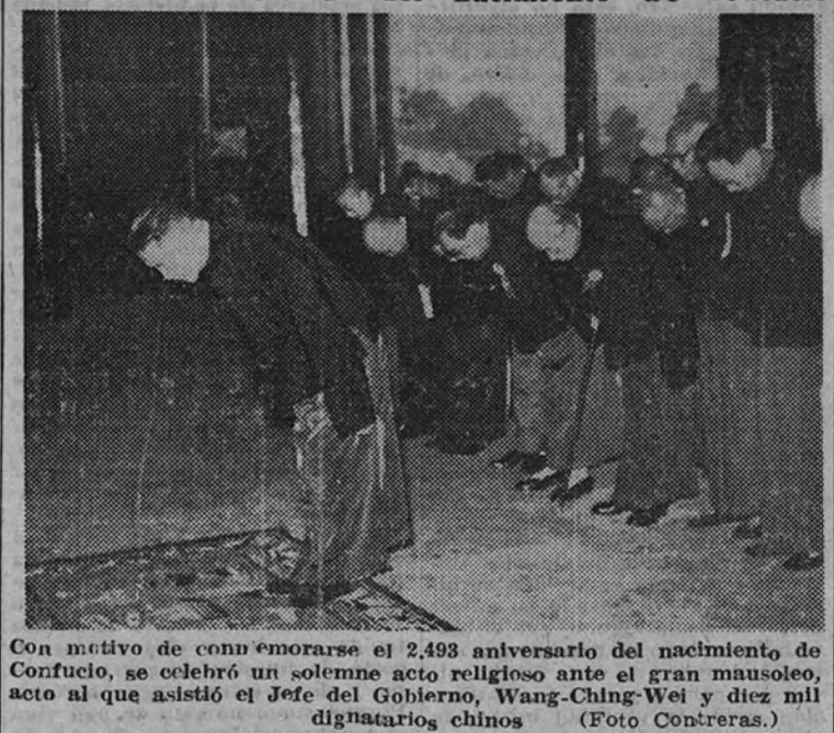
Con motivo de conmemorarse el 2.493 aniversario del nacimiento de Confucio, se celebró un solemne acto religioso ante el gran mausoleo, acto al que asistió el Jefe del Gobierno, Wang-Ching-Wei y diez mil dignatarios chinos.

El 2.493 aniversario del nacimiento de Confucio