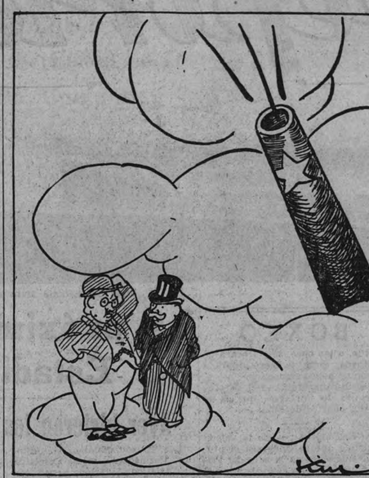
—Caramba, caramba; con lo bien que se estaba en las nubes...