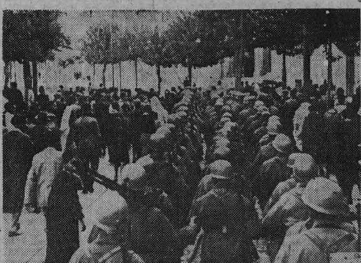
Un batallón alemán cruza las calles tunecinas después de su desembarco, siendo acompañado en su recorrido por la población indígena

GRAN CUARTEL GENERAL DEL FUHRER 18.—Comunicado del Alto Mando de las fuerzas armadas alemanas: «En el norte de África, las operaciones de ataque emprendidas hace varios días han continuado con éxito. Formaciones aéreas intervinieron en los combates de tierra y ocasionaron sensibles pérdidas al enemigo en armas pesadas y vehículos motorizados. Al oeste de Argel, una formación de bombarderos alemanes ha hundido un mercante adversario de 8.000 toneladas y ha averiado otro del mismo desplazamiento.» (Efe.) LAS TROPAS DEL EJE CONSOLIDAN SUS AVANCES BERLIN 18.—La Oficina Inter-