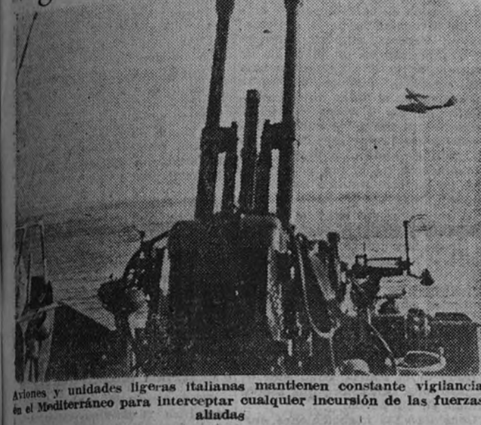
Aerones y unidades ligeras italianas mantienen constante vigilancia en el Mediterráneo para interceptar cualquier incursión de las fuerzas aliadas