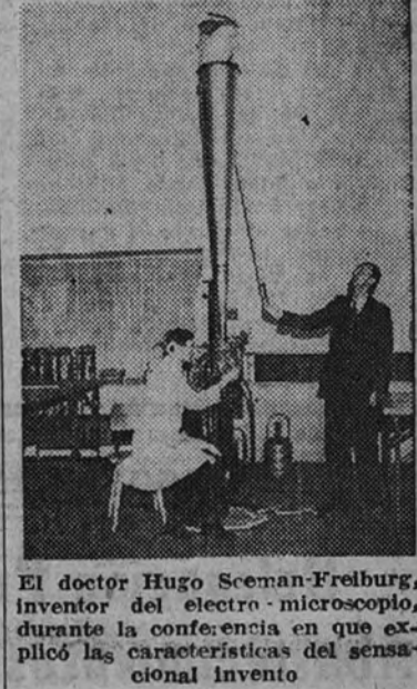
El doctor Hugo Seman-Freiburg, inventor del electro-microscopio, durante la conferencia en que explicó las características del sensacional invento