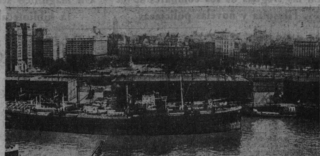
Una vista parcial de la ciudad de Buenos Aires, la capital más populosa de habla española en el mundo. En primer término un aspecto de los muelles del Río de la Plata.

Comenzaron entonces los heroicos caminos de las divisiones de infantería. Los ingleses, y con sus potentes divisiones blindadas, aplastaban en realidad la cobertura levisma de un repliegue colosal. Es cierto que la Aviación se lanzaba en oleadas sobre el grueso de la retirada; pero, salvo los destrozos que esta Aviación, que nunca dejó, a la vez, de encontrar enemigo en las escuadillas contrarias, pudo ocasionar en las columnas blindadas, estas consiguieron llegar hasta el límite tunecino. Ya antes las nuevas divisiones que aun no habían combatido ha-