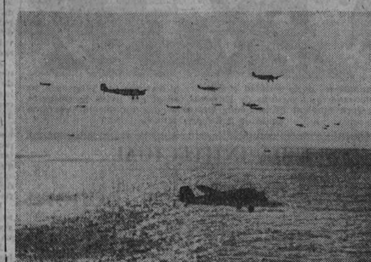
Los aviones del Eje de transporte no cesan en sus viajes llevando al frente tunecino hombres y material. En la foto, una escuadra de aviones cruza el Mediterráneo en dirección al territorio africano.