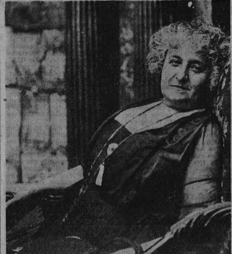
De las comediantas españolas, la más ilustre, la más personal, la que hace revivir nuestra escena con más autoridad y mejores matices, es María Guerrero. No hubo género teatral que no fuese cultivado por la eminente actriz, y en todos alcanzó resonantes triunfos. Traemos hoy a nuestras páginas el recuerdo de la actriz genial, que con su arte llenó de gloria durante muchos años la escena española.