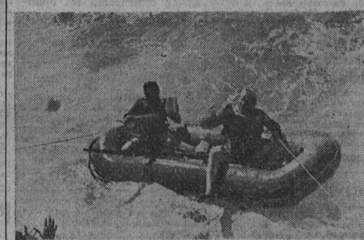
Abatido al mar su aparato por un avión enemigo, los dos aviadores alemanes permanecieron varios días a bordo de la lancha neumática. La abundante provisión de conserva les permitió resistir el tiempo suficiente, hasta que un barco de socorro del Reich logró rescatarlos del Océano.