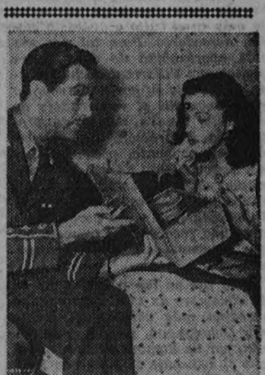
Vivien Leigh y Robert Taylor son los intérpretes de la nueva versión de «El puente de Waterloo», que ha realizado Mervyn Le Roy. En esta foto, obtenida durante un intervalo del trabajo, aparecen las dos estrellas arreglándose el maquillaje.

Y nada más tengo que añadir por ahora a esta invasión que en el cine español han hecho quienes yo encuentro mejor impuestos para ello, no sólo por el mucho cine que han visto con anterioridad y su indiscutible vocación, sino por la inteligencia de que ya van dándonos muestra en esos primeros tanteos, y cuyos defectos aislados habrán de ir corrigiendo poco a poco, hasta oírlos en la película perfecta que nosotros aplaudamos sin reserva.