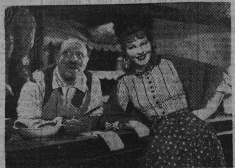
Luisa Llanusa, considerada como la mejor actriz italiana: el pasado año, en una escena del film «Bodas de sangre», que ha dirigido Goffredo Alessandrini, con Fosco Giachetti y Beatrice Mancini como trío interpretativo.

El próximo lunes estrenará en el teatro la compañía de Lola Montes, cuyo título es «Otra vez vi».