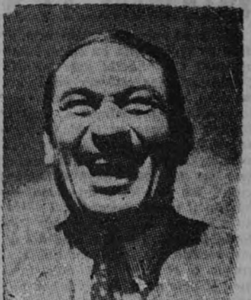
Victor Mc. Laglen

Ahora hace exactamente veinte años que yo empezaba a sentir por el cine una curiosidad manifiesta, que más tarde habría de tornarse en fervida adhesión. Leta entonces todas las semanas «La Pantalla», una revista profesional muy interesante, que me informaba detalladamente de todo cuanto quería saber en relación con el arte de las imágenes. Esta puedo decir que fué mi cartilla cinematográfica—datos útiles, nombres de estrellas y directores, fotografías de los films de la época—, y aun hoy día la tengo en gran estima, pues su colección completa es un magnífico archivo de consulta en las horas de trabajo ante las cuartillas. La buena memoria también es una fiel compañera en mi tarea de escritor de cine desde que empecé a comentar el hecho cinematográfico en todos sus aspectos.