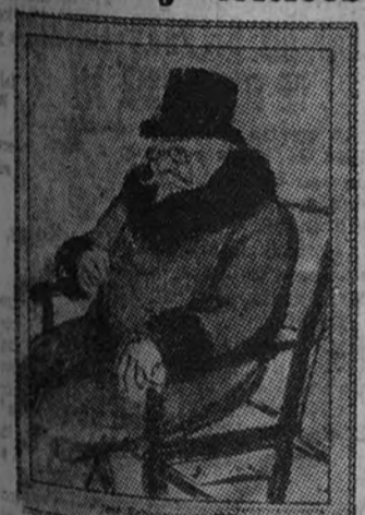
En Bombay dicen que hay terrible peste bubónica. Y que Orrecha hace la crónica de un drama de Echeagary. ¡Mejor están en Bombay!