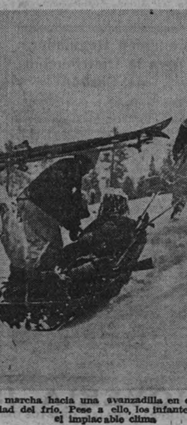
Un grupo de soldados alemanes marcha hacia una avanzadilla en el frente de Laponia. A la dureza de la guerra se une aquí la crueldad del frío. Fese a ello, los infantes del Reich cubren sus objetivos bajo el implacable clima.