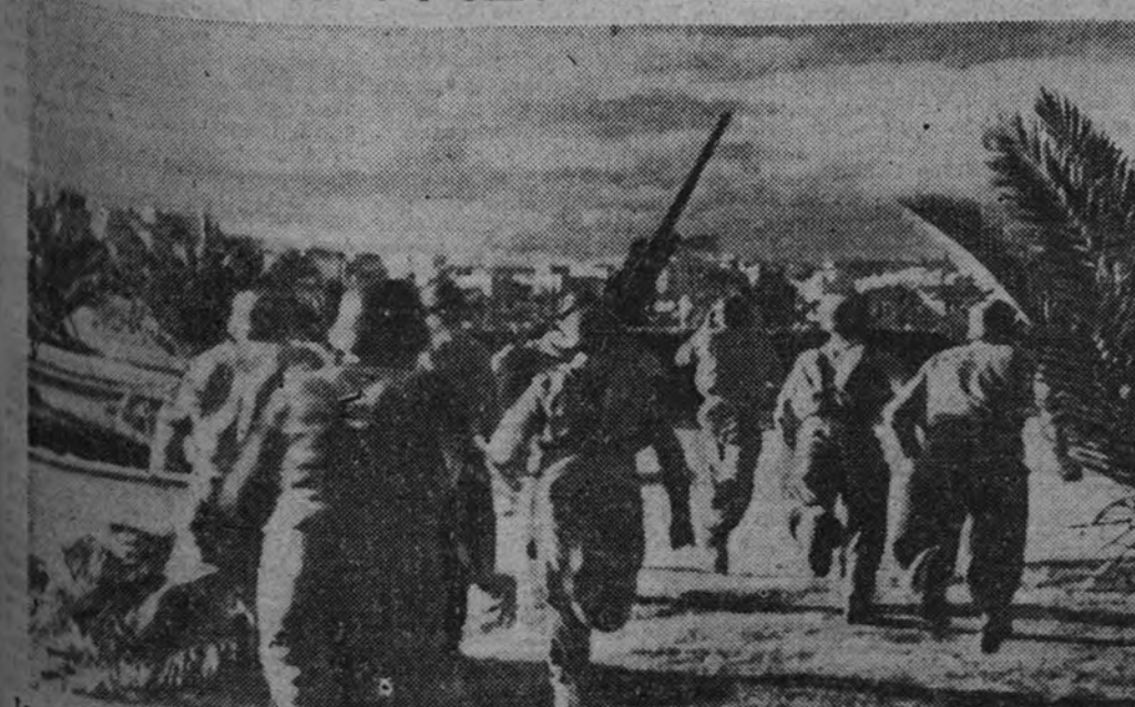
Las señales de alarma acaban de sonar, y los soldados, de la defensa antiaérea corren hacia sus puestos. Pronto las baterías entrarán en acción contra los aviones anglosajones.