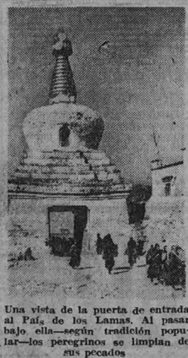
Una vista de la puerta de entrada al País de los Lamas. Al pasar bajo ella—según tradición popular—los peregrinos se limpian de sus pecados.