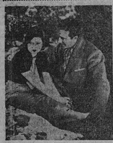
Una escena de «Sor Angélica», el film español cuya repoblación se anuncia.

Santoral.—San Leandro, obispo, confesor y doctor. Santos Alejandro, Abundio, Antigono y Julián, mártires; Basilio, Procopio y Baldo. La misa y oficio, de San Leandro, con rito doble mayor y color blanco. Cusrenta Horas.—Religiosas Reparadoras.