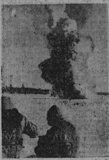
La Artillería soviética anuncia la proximidad del ataque. Los infantes del Reich ocupan sus puestos para rechazar la acometida de los rusos

Entre la desmembradura del Don, el Donetz y el Dniéper, los soviéticos se mantuvieron a la expectativa. Por el contrario, las fuerzas alemanas prosiguieron sus operaciones de cerco y aniquilamiento de las unidades soviéticas aisladas. El Ejército blindado soviético está próximo a su fin; sus pérdidas se cifran hasta ahora en 479 tanques, 280 cañones, 300 camiones, 187 vehículos de transporte, 1.635 soldados enemigos han sido hechos prisioneros. El campo de batalla está sembrado de cadáveres, habiéndose contado hasta ahora más de doce mil. Como quiera que las unidades blindadas alemanas han penetrado profundamente en el dispositivo soviético, resulta imposible precisar la cuantía de las pérdidas soviéticas.