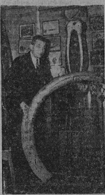
W. S. Van Dyke

El día 5 del corriente mes ha fallecido el creador inolvidable de «Sombras blancas» y «Eskimo», William S. Van Dyke. Con su desaparición pierde el cine norteamericano uno de los mejores realizadores cinematográficos. Se puede calificar de aventurero, simpático y atractiva la vida de este realizador mejicano, que nació en San Diego el 28 de marzo de 1887. Pasó toda su juventud en su pueblo natal, donde trabajó como minero en unas minas de cobre, cuyo duro trabajo abandonó para hacerse periodista, pasando algún tiempo después a la Casa productora americana Metro Goldwyn Mayer, para quien ha trabajado siempre.