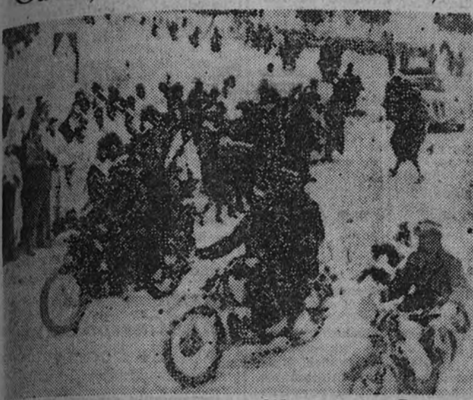
Ha aquí una de las primeras fotos recibidas de la victoriosa acción del Eje en Túnez: Las tropas italianas entran en Gafsa después de haber sido abandonada por las derrotadas tropas anglosajonas