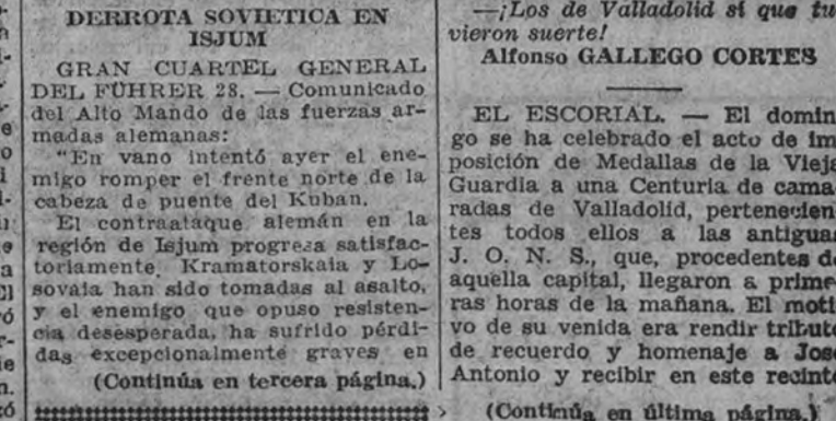
Camaradas de la Falange vallisoletana, a quienes se les impuso la Medalla de la Vieja Guardia