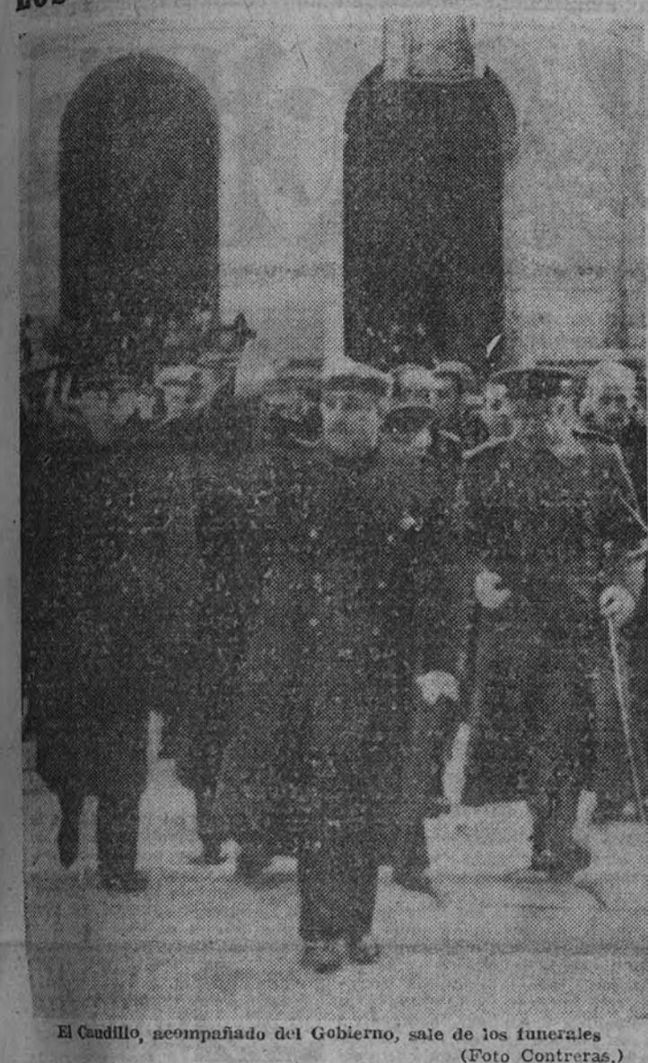
El Caudillo, acompañado del Gobierno, sale de los funerales.