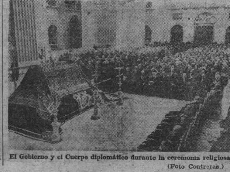
El Gobierno y el Cuerpo diplomático durante la ceremonia religiosa

ción de nuestros cazas y el último derribado por un caza alemán al sur de Corleone. Cerca de Marie Casale, Palermo, han sido capturados los tripulantes de un avión inglés que cayó en el mar.” BOMBARDEO DE SAINT NAZAIRE LONDRES 1.—Oficialmente se anuncia que los bombarderos aliados lanzaron ayer sobre Saint Nazaire mil toneladas de bombas en treinta minutos. (Efe.)