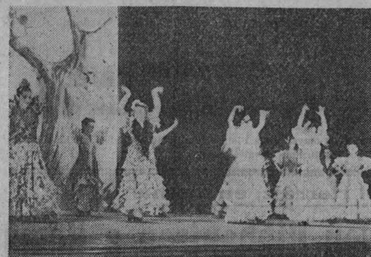
Grupo de danzas de la Sección Femenina de la provincia de Sevilla

EL PASADO AÑO SE PRESENTARON 4.000 CAMARADAS