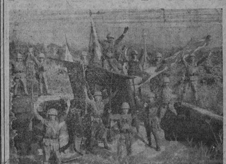
Fuerzas japonesas de asalto, momentos después de haber desembarcado en una isla del Pacífico, se apoderan de un emplazamiento de artillería de gran alcance para la defensa costera.