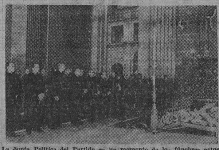
La Junta Política del Partido en un momento de los fúnebres actos