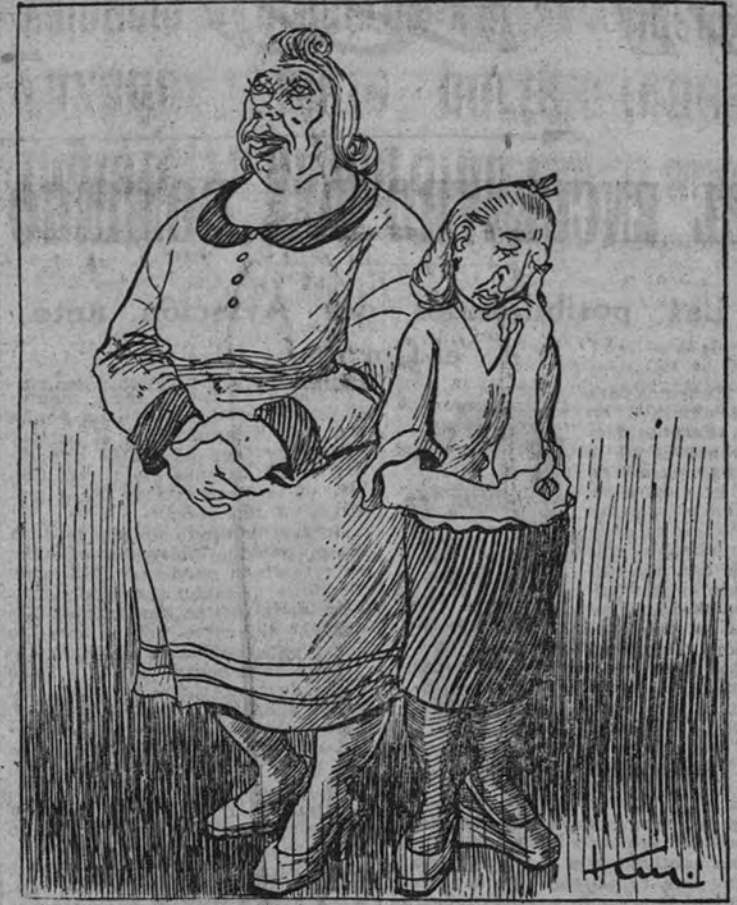
—Otro año perdido!