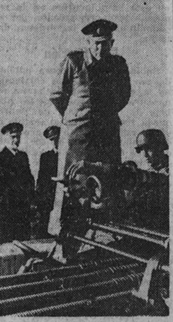
El general Marshall inspecciona las fortificaciones emplazadas en la costa mediterránea de Francia.