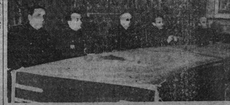
Jerarquías que presidieron el acto