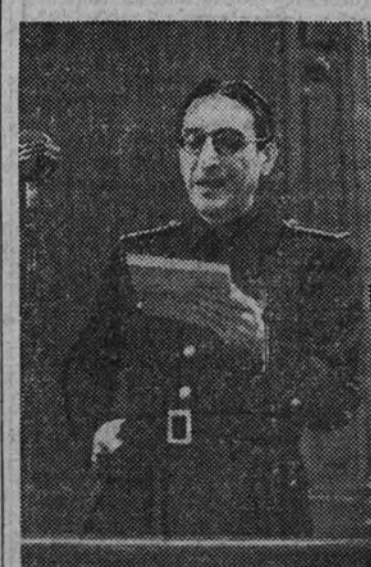
Ayer, en el Paraninfo de la Universidad Central, el Consejero Nacional camarada Rafael Sánchez Mazas, dio una lección nacionalista a los camaradas de la Milicia Universitaria.

“La defensa de España tiene un solo Jefe y un solo nombre: FRANCISCO FRANCO”