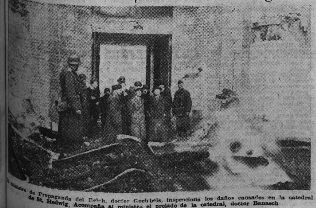
Ministro de Propaganda del Reich, doctor Goebbels, inspecciona los daños causados en la catedral de St. Hedwig, Acompaña al ministro el prelado de la catedral, doctor Banasch