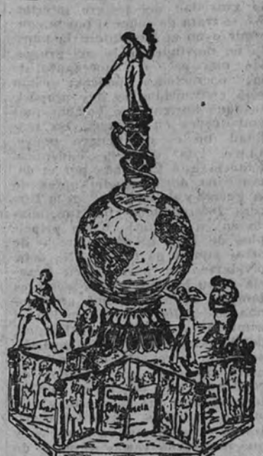
Una falla de este año, con la representación de los pecados capitales

Esta intención lamiadora y expresiva que suele ser el todo de una falla obedece este año, acaso más que cualquier otro, a la condición originaria de la fiesta: a su urbanismo esencial. La falla es, en su concepción y en su total factura, una obra del hombre de la calle o, mejor, del hombre de barrio. Siendo Valencia una de las ciudades españolas más directamente influidas por el campo, deja, como es lógico, al ingenio de su artesanía urbana el quehacer de dirigir la gran diversión anual. El huertano sólo desempeña el papel de «cinco». Ofrece una adecuada representación plástica, pero cierta cantidad de dinero (si es, como ocurre cada día más, labrador domiciliado en la capital) y sufre con paciencia el desenfreno humorístico con que la ciudad fallera se entrega y abraza sus trapecios en orden al apareamiento y venta lícita de los frutos regionales.