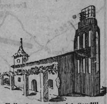
Falla de la plaza del Caudillo

Esta falla, absolutamente excepcional y fuera de concurso, invierte un presupuesto superior a las docenas mil pesetas. Su castillo de fuegos artificiales, especial para la deslumbradora «Nit del foc»,