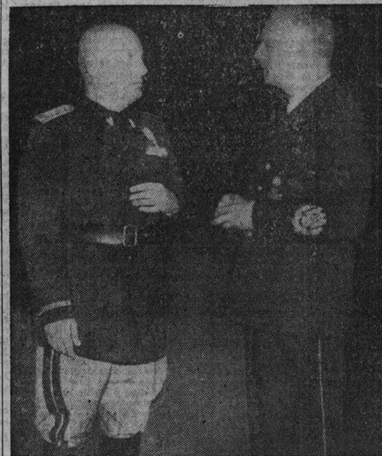
Recientemente se entrevistaron en Roma el jefe del Gobierno italiano y el ministro de Asuntos Exteriores del Reich. La foto nos muestra un momento de las conversaciones sostenidas entre Mussolini y von Ribbentrop.