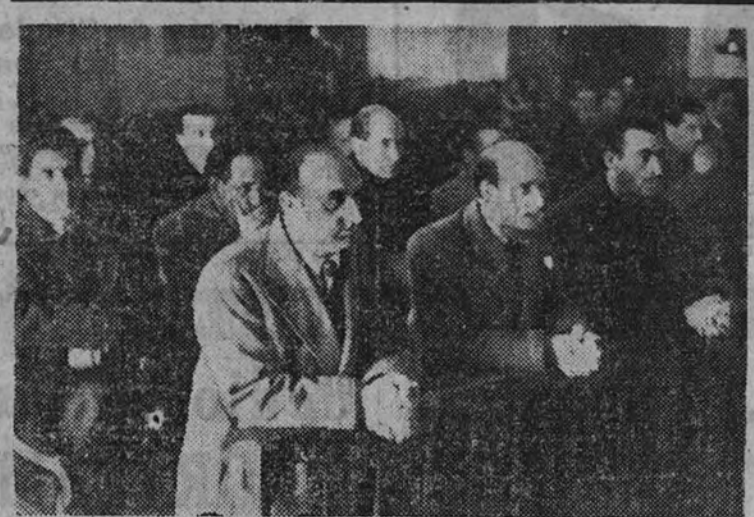
En la mañana de ayer, con motivo de conmemorar el aniversario de la constitución del Sindicato Nacional del Papel, Prensa y Artes Gráficas, se celebró una misa en la capilla de la Santísima Trinidad, a la que asistió el Secretario Nacional, acompañado de las jerarquías, Jefes de Sectores y personal del Sindicato.