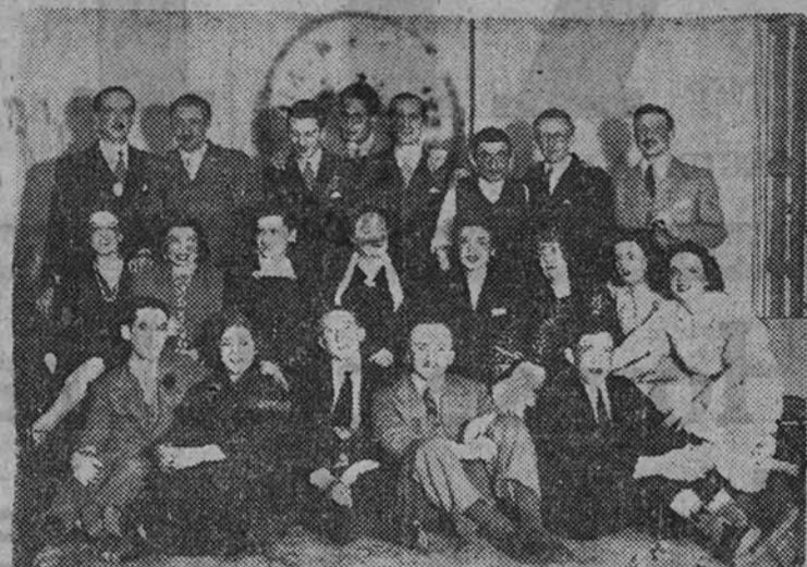
Seguendo las normas de la Obra Provincial Educación y Descanso, uno de los primeros Grupos de Empresa constituidos ha sido el de Minerva, S. A., cuyo Cuadro Artístico ha dado una representación en el teatro Español de la obra «Lo increíble», con señalado éxito.