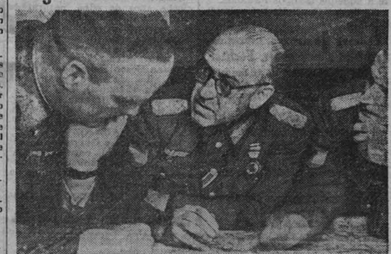
El general jefe de la División Azul estudiando en su puesto de mando con el jefe de una División alemana, con la que enlaza nuestra gran División, las posiciones enemigas sobre el mapa.