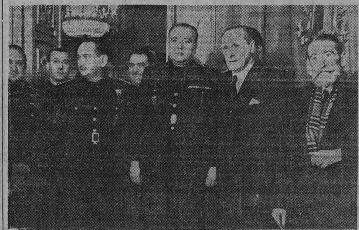
El Ministro Secretario General del Movimiento con los señores Bilbao y Aunós, durante el acto de toma de posesión del último como nuevo Ministro de Justicia.