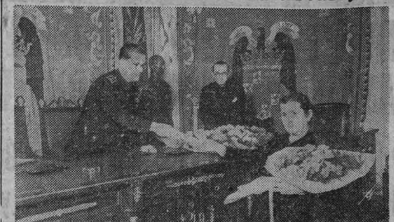
El Subsecretario de Trabajo, camarada Esteban Pérez, haciendo entrega en el Instituto Nacional de Previsión de uno de los premios a la Natalidad.

El camarada Esteban Pérez dijo que con estos premios se hacen realidad las declaraciones del Fuero del Trabajo