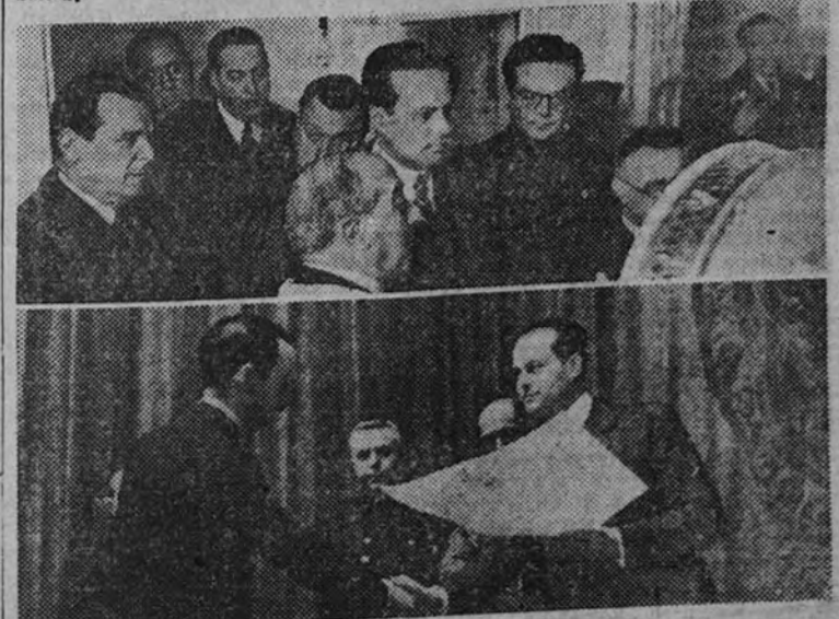
El Ministro de la Gobernación en su visita de ayer a los servicios del Hospital Provincial. En la fotografía inferior el Ministro entregando los títulos a los ingenieros de Telecomunicaciones