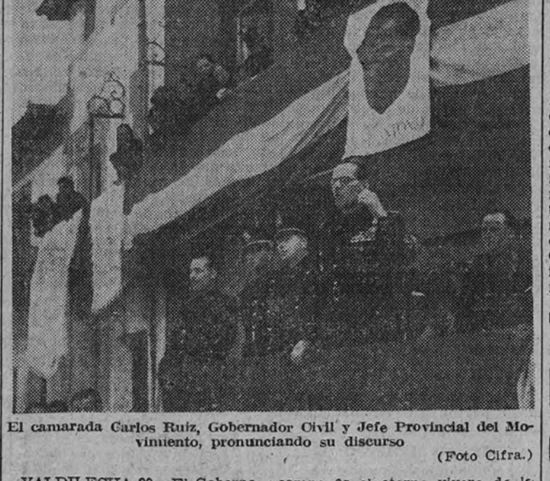
El camarada Carlos Ruiz, Gobernador Civil y Jefe Provincial del Movimiento, pronunciando su discurso.