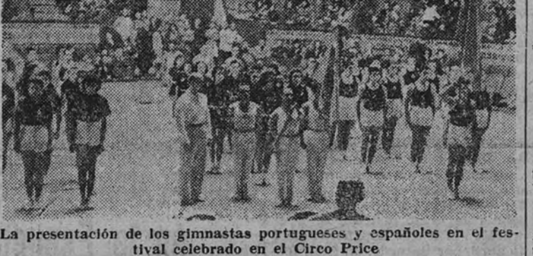
La presentación de los gimnastas portugueses y españoles en el festival celebrado en el Circo Price