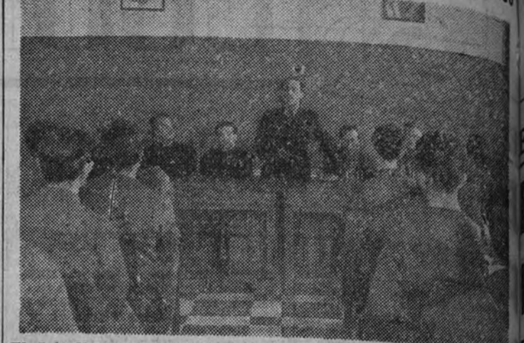
El Jefe Nacional del S. E. U., camarada Valcárcel, pronunciando una conferencia en el cursillo para Mandos de Albergues Universitarios en La Granja

LA GRANJA DE SAN ILDEFONSO 29.—En el Hogar de Mandos para Albergues Universitarios ha tenido lugar la solemne inauguración del primer curso formativo de los futuros jefes de los Albergues.