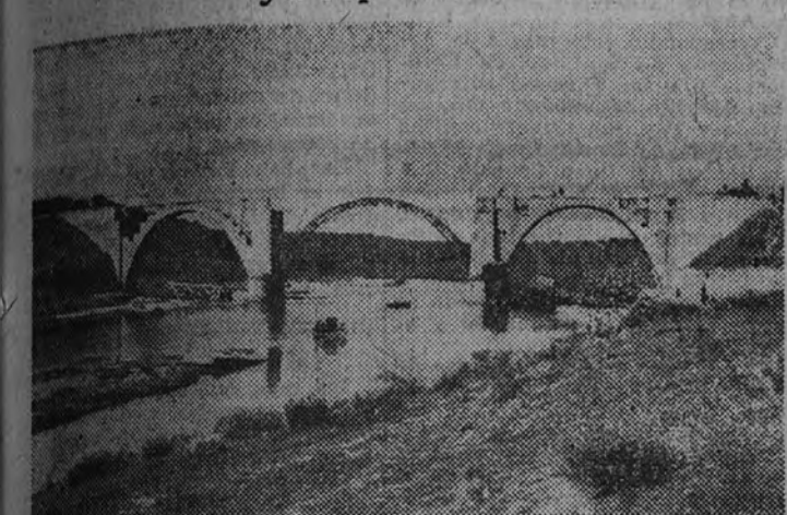
El nuevo puente sobre el río Agueda, en el ferrocarril de Salamanca a Fuentes de Oñoro.—Estado de las obras en 4 de marzo de 1943

Estaba interrumpida desde el 21 de diciembre de 1942 por rotura de un puente, ya reparado