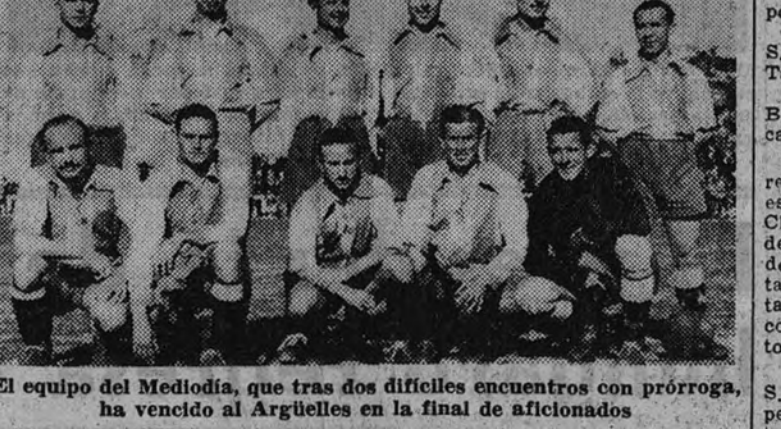
El equipo del Mediodía, que tras dos difíciles encuentros con prórroga, ha vencido al Argüelles en la final de aficionados

También hubo que jugar la prórroga en el desempate