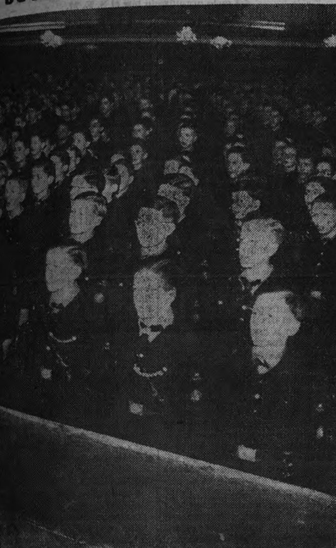
Afiliados a las Juventudes Hitlerianas, en la ceremonia del juramento