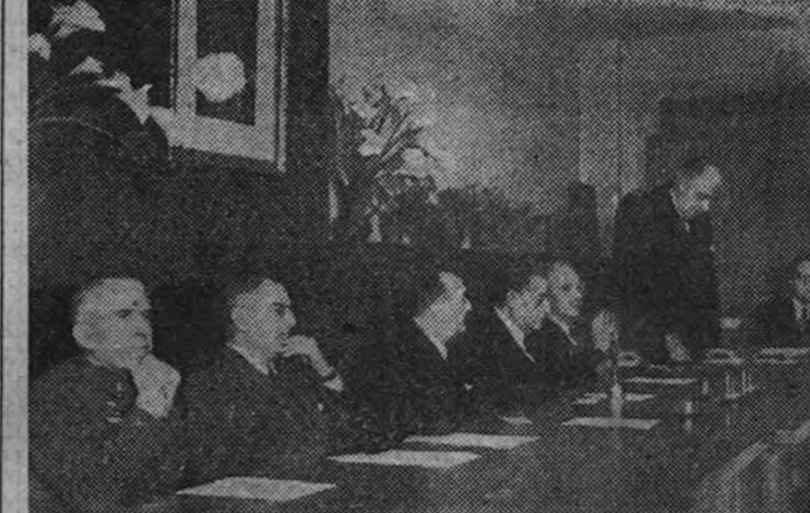
El Ministro de Obras Públicas preside el acto celebrado en el Instituto de Ingenieros Civiles, con motivo del LXXV aniversario del descubrimiento del principio dinamoeléctrico. (Información en segunda página)