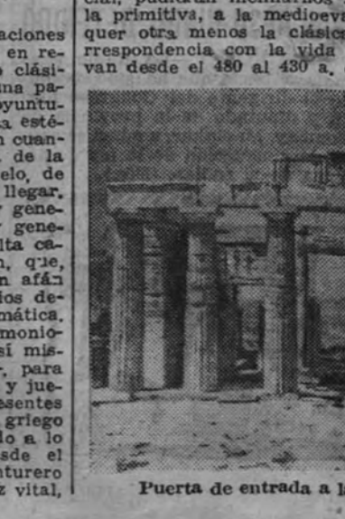
Puerta de entrada a la Acrópolis de Atenas

El éxito ha sido de tal naturaleza, tal el entusiasmo del público portugués al final de la audición, que no nos resistimos a la tentación de anticiparlo así al aficionado madrileño, que tendrá noticia detallada a través de la crónica que le dedicará el crítico musical de ARRIBA y Secretario General de la Comisaría de Música, Federico Sopeña, actualmente en Portugal.