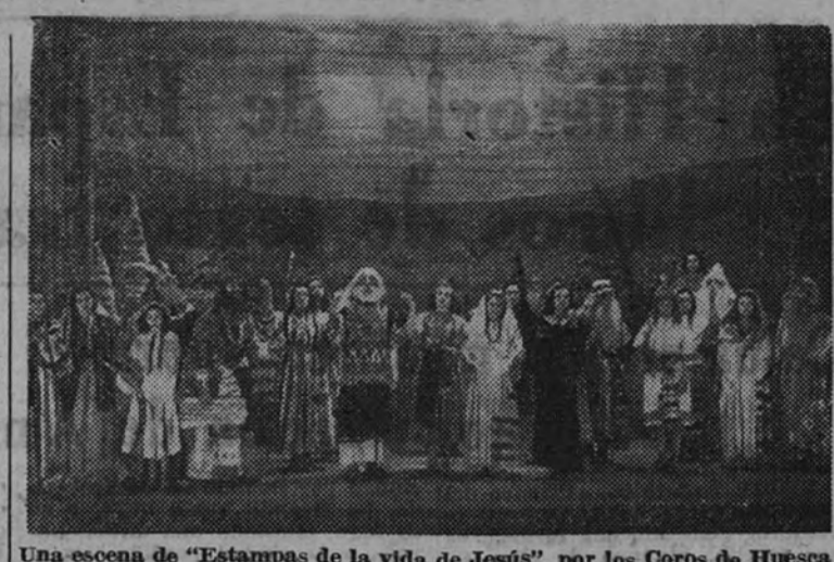
Una escena de "Estampas de la vida de Jesús", por los Coros de Huesca

El sábado de gloria con la ópera "Aida", interpretada por la Cigna, la Ulisse, Granda, Torres y el bajo Flaminio, y dirigida por el maestro Annovazzi.