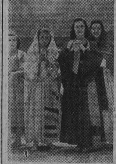
Otra escena de "Estampas de la vida de Jesús", por los Coros de Huesca

LISBOA 7. (De nuestro servicio especial).—Esta noche, en el teatro San Carlos, Lisboa, se ha celebrado el gran concierto de gala a cargo de la Orquesta Nacional, dirigida por el maestro Halffter y actuando como solista José Cubelles.