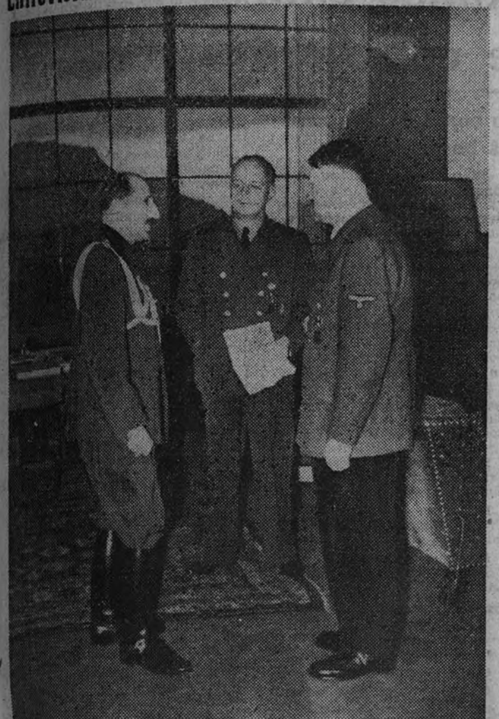
Recientemente recibió el Führer la visita del Rey Boris de Bulgaria, en presencia del ministro de Asuntos Exteriores, von Ribbentrop. En la foto, las tres personalidades de la política europea, en un momento de las conversaciones.