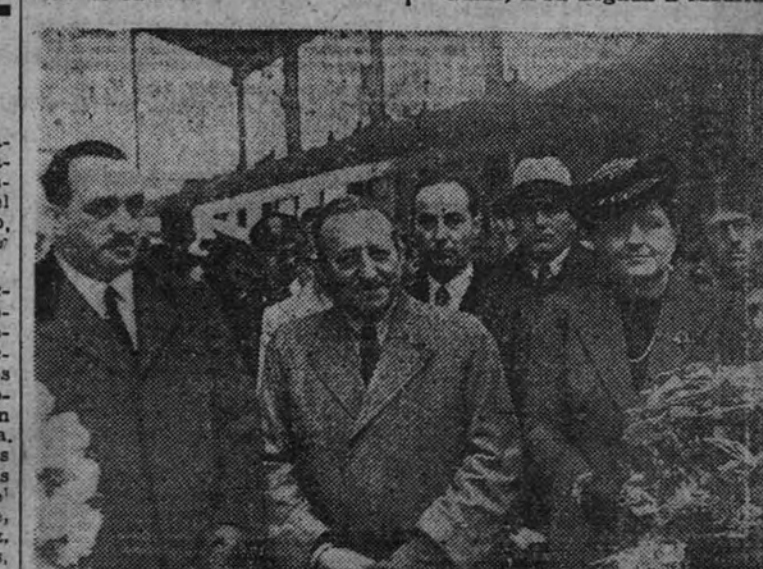
El marqués Paulucci di Calboli, a su llegada a Madrid.