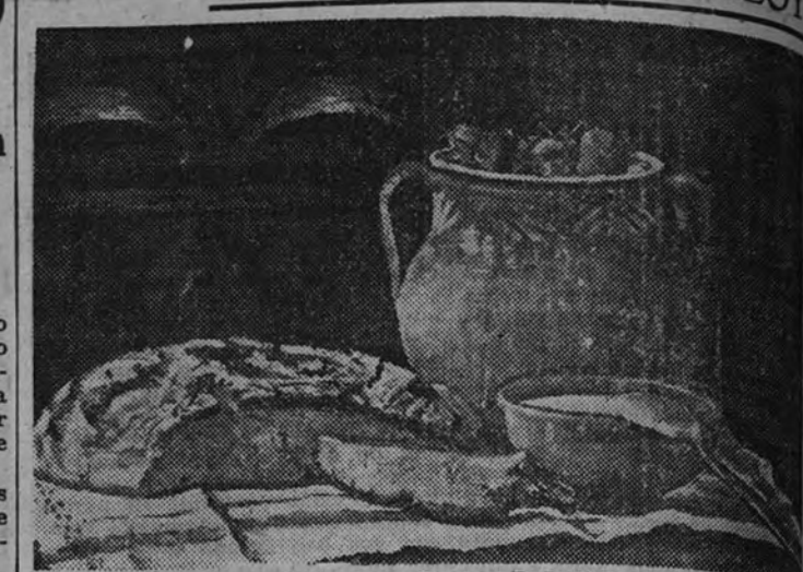
«Bodegón», por Carmen R. Legisima