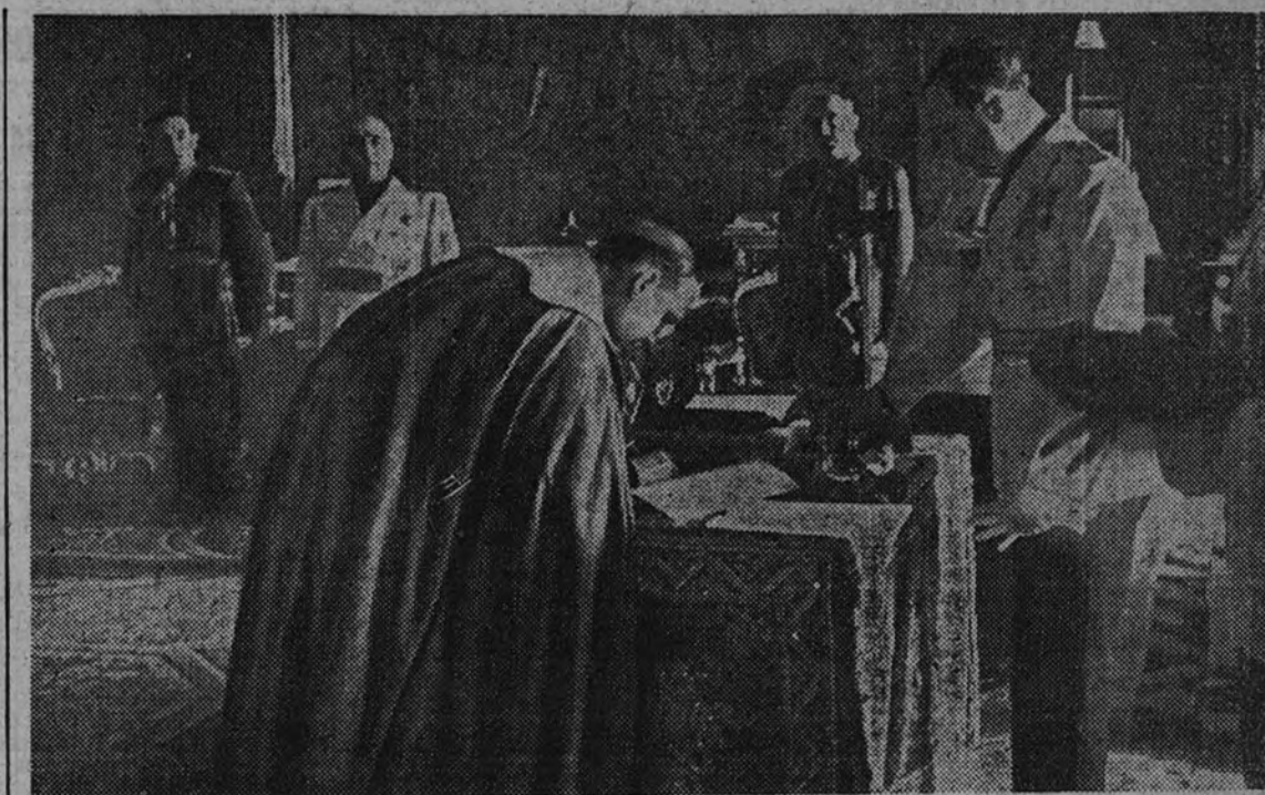
En el Palacio del Pardo, los nuevos obispos recientemente nombrados prestan juramento ante el Caudillo. La foto nos muestra el momento en que uno de los prebendados firma el acta después de la jura.

El Ministerio de Asuntos Exteriores comunica que el consúl general de España en Bruselas telegrama que la colonia española de Amberes no ha tenido víctimas ni sufrido daños como consecuencia del último bombardeo de aquella ciudad.