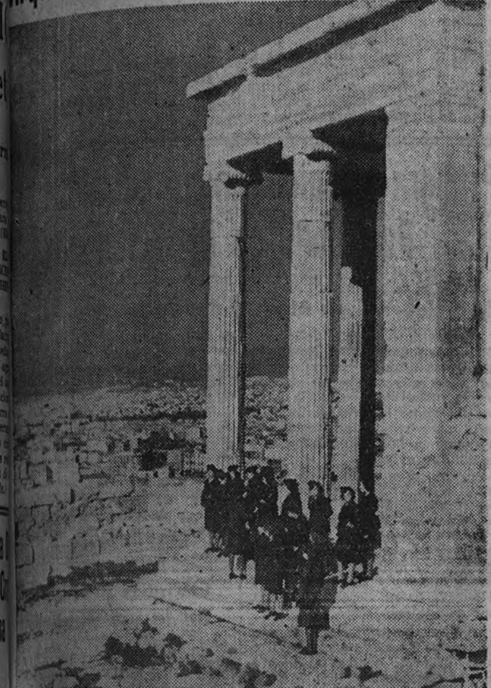
Después de la fatigosa jornada, un grupo de muchachas telegrafistas almanas visitan las joyas arquitectónicas de la vieja Atenas.