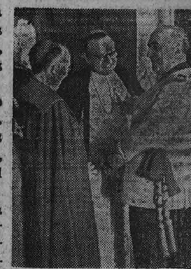
Al terminar el acto de la jura, el Caudillo conversa con los nuevos prebendados.

A continuación el Caudillo obsequió con un almuerzo a los nuevos obispos, al que fueron invitados también el Gobierno, el Presidente de las Cortes, el Nuncio de Su Santidad, el arzobispo Primado de España, el obispo de Madrid-Alcalá, el Subsecretario de la Presidencia del Gobierno y el introductor de embajadores.