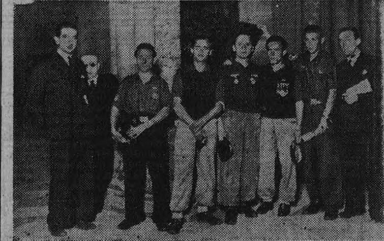
Cumpliendo una promesa hecha en el frente ruso, un grupo de voluntarios de la División Azul fué en peregrinación a Santiago, en viaje a pie, para dar gracias al Apóstol y ganar el Jubileo del Año Santo