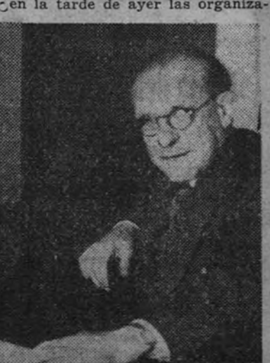
(Continúa en cuarta página)