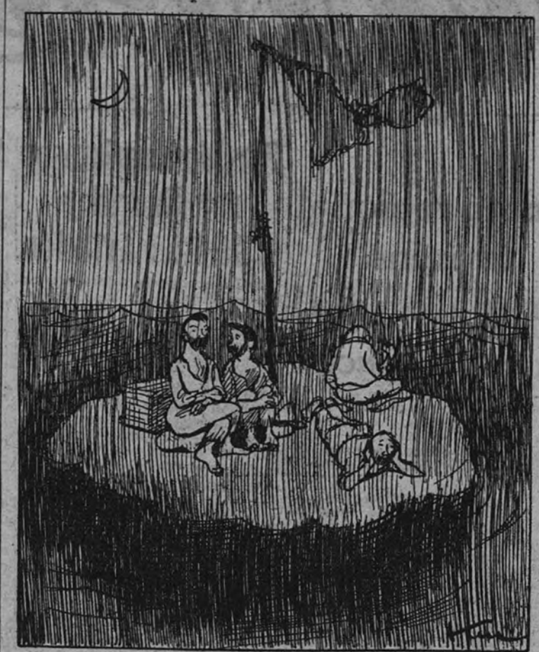
—¿A cómo estaremos ya? —Debe ser la noche del sábado, porque se ven muchas merluzas.

La ilustración muestra un submarino siendo atacado por torpedos lanzados desde un barco. Se ven varias merluzas nadando en la superficie del agua.