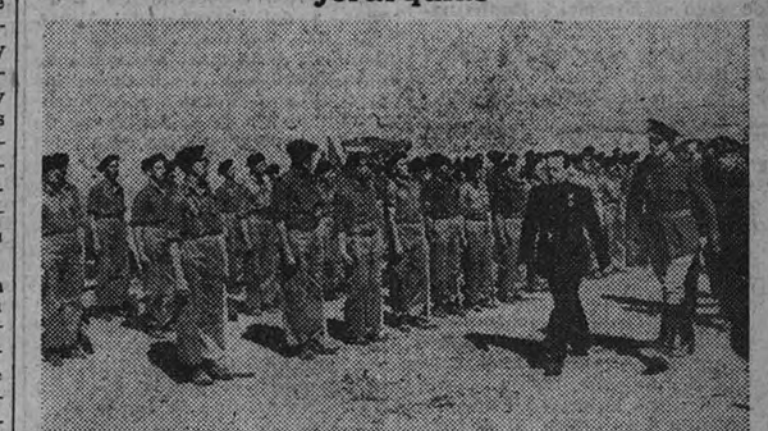
El Delegado Nacional de Sindicatos pasa revista a los productores locales del Partido.

Concurrieron el Vicesecretario de Obras Sociales, Subsecretario de Trabajo, Jefe Provincial del Movimiento y otras jerarquías