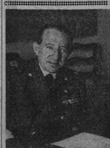
Nuestro Ministro de Asuntos Exteriores, conde de Jordana, recibió ayer la primera visita del nuevo embajador de Italia en España, marqués Giacomo Paulucci di Calboli

VALENCIA 10.—El Ministro de la Gobernación, camarada Blas Pérez, marchó a las once de la mañana al Ayuntamiento, donde fué recibido por el Alcalde, Jefe Provincial del Movimiento, Presidente de la Diputación y otras autoridades y jerarquías. Desde el Ayuntamiento fué acompañado por el Gobernador Civil, directores generales de Administración Local y Regiones Devastadas, su secretario particular y el Jefe de la Secretaría Política del Ministerio. El camarada Blas Pérez, que fué objeto de grandes muestras de simpatía por parte del personal de la Casa, visitó el Salón Pompeyano examinó los planos de la avenida del Oeste y las otras calles afectadas por la guerra y ensalzó de Valencia, Ayuntamiento tiene en marcha el plan de viviendas que el Ayuntamiento, desde el Ayuntamiento, por la avenida del Oeste, se dedica a la Ciudad Sanitaria de Valencia, donde recorrió detenida-