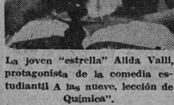
La joven "estrella" Alida Valli, protagonista de la comedia estudiantil a las nueve, lección de Química.