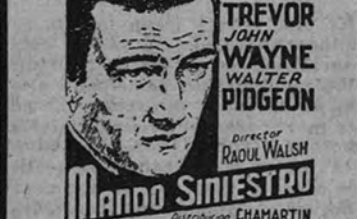
Dinamismo, acción y realidad, que nos traen de nuevo a las excelencias del verdadero cine.