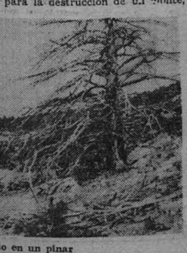
Razo de incendio en un pinar

Aun los fueros de la propiedad forestal privada deben tallarse fuertemente comprimidos ante las conveniencias trascendentales de la colectividad; se trata, en efecto, de una de las cuestiones que afectan profundamente al bienestar y a la seguridad de la sociedad, y ante las cuales resulta flagrante mentira que cada cual pueda hacer de su capa un sayo. Todos los modos de propiedad material tienen sus peculiaridades limitadas, y si al dueño de un auto-móvil no se le permite circular por las aceras, ni al de una escopeta cazar en un parque público, ni al de un solar edificarlo a "u" libre, albedrío—todo por los daños, molestias o inconvenientes que posiblemente pueden originar—no hay razón que abone el permiso para la destrucción de un monte,