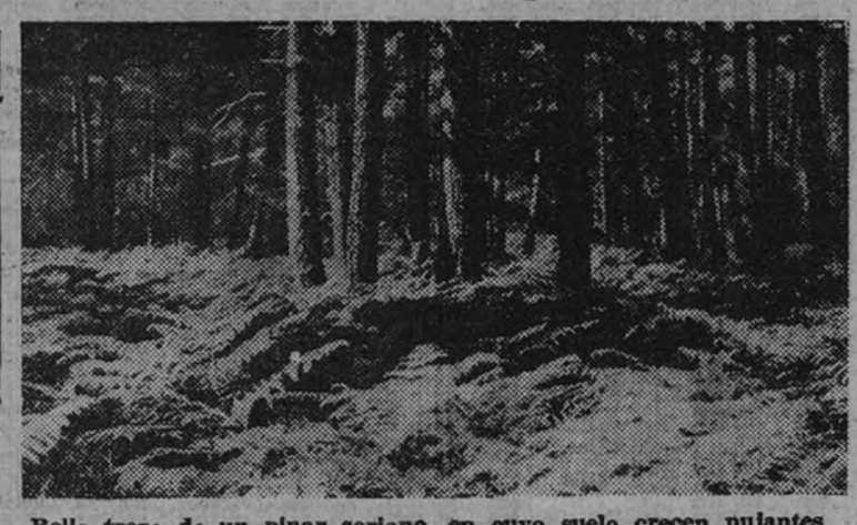
Bello trozo de un pinar soriano, en cuyo suelo crecen pujantes los helechos

Miles de hectáreas del territorio español perdieron, en poco tiempo su cubierta forestal, sin ningún beneficio para la colectividad. Mezquineros intereses privados, ruinosas roturaciones, pastoreos, y desconcertante inhibición de los Poderes públicos—corazón de la funesta tarea, seguidos de desidia, y con excesiva frecuencia, que fueran, por el duro castigo de la Naturaleza, los fenómenos de los continuos arrastres de tierra, las inundaciones, etc., etc., que agotan los montes, han ido en rotación, disminuyendo eficaces camuflajes de acción de la agricultura y la ganadería, "Trisaguiendo" de los nuevos de "tro", que hoy temerá la pujanza de nuestro brioso resurgimiento, sabiendo a