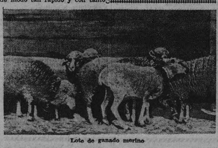
Lote de ganado merino

La veda difícil de exterminio de estos animales.