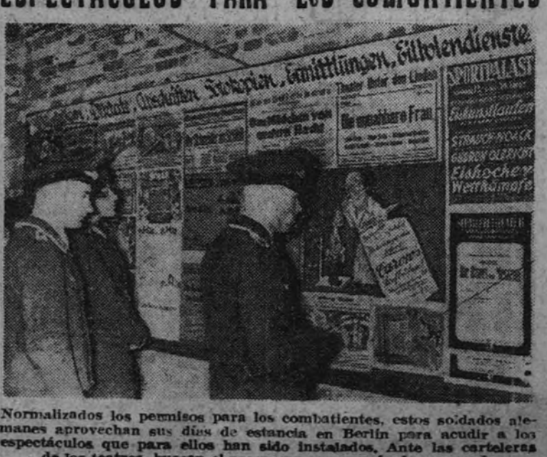
Normalizados los permisos para los combatientes, estos soldados alemanes aprovechan sus días de estancia en Berlín para acudir a los espectáculos que para ellos han sido instalados. Ante las carteleras de los teatros, buscan el programa que es más de su agrado.