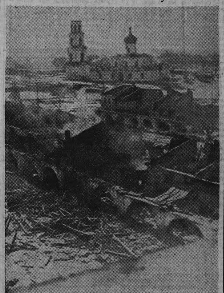
Un aspecto de la ciudad, heroicamente defendida por las tropas alemanas, después de un bombardeo soviético.