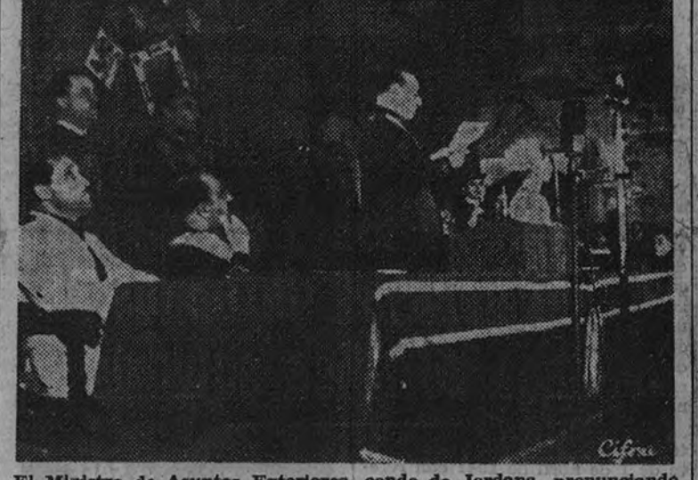
El Ministro de Asuntos Exteriores, conde de Jordana, pronunciando su discurso en Barcelona.

Una vez más se ha puesto de manifiesto la tradicional amistad hispanoitaliana