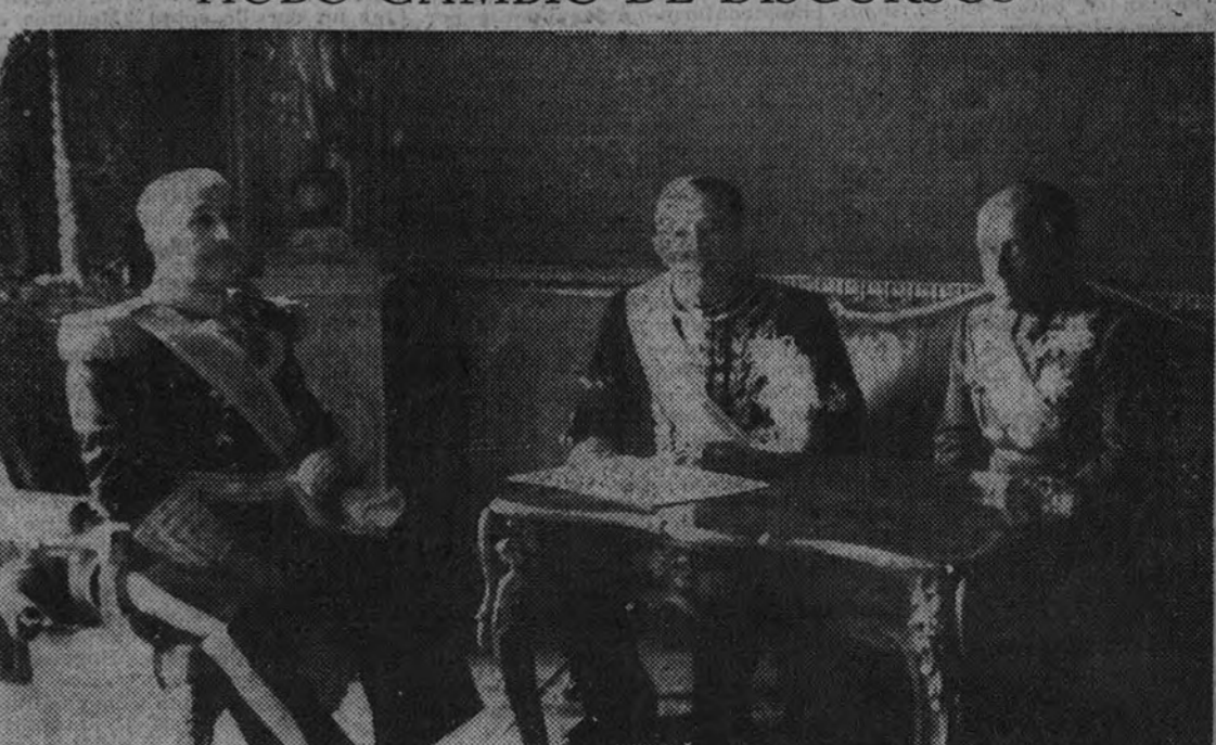
El nuevo embajador italiano, acompañado del Ministro de Asuntos Exteriores, conde de Jordana, conversa con el Caudillo momentos después de presentarle sus cartas credenciales.

CON ARREGLO AL NUEVO PROTOCOLO, NO HUBO CAMBIO DE DISCURSOS