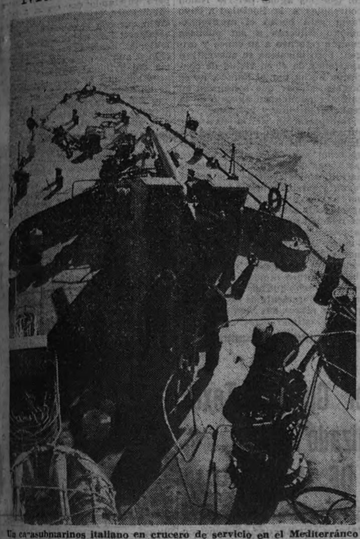
Un submarino italiano en crucero de servicio en el Mediterráneo