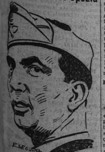
El príncipe Humberto visita los barrios bombardeados de Spezia

GRAN CUARTEL GENERAL DEL FUHRER 20.—El Alto Mando de las fuerzas armadas alemanas comunicó: "Al sur de Novorossisk continúan con encarnizamiento los combates, en los que han participado formaciones considerables de la Luftwaffe. Frente a la costa occidental del Cáucaso, una lancha rápida enemiga ha sido hundida por nuestros aviones de bombardeo, que averiaron a otras tres embarcaciones."