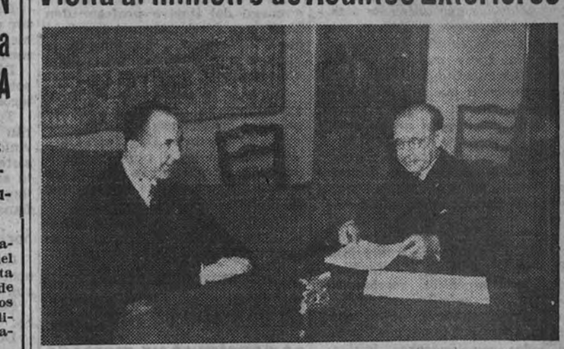
El nuevo embajador de Alemania en España, doctor Hans Heinrich Dieckhoff, visitó ayer mañana al Ministro de Asuntos Exteriores, señor conde de Jordana