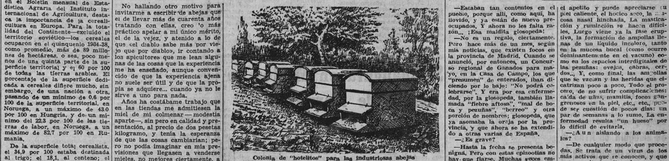
Colonias de "hotelitos" para las industriosas abejas

Los hogares españoles. Algo de lo que se ha conseguido en países en que no se produce la miel con la facilidad que en el nuestro; y no obstante, se consume en las tres comidas del día, de modo similar a lo ocurrido en España con la manteca, no vista en mi juventud más que en los restaurantes de categoría o en las casas de aristócratas ricos o burgueses adinerados, y hoy, más o menos emarginada, consumida por muchas toneladas anuales. Pero este ideal debe de conseguirse no a estilo de pescadores en río revuelto, sino de españoles que desean licitamente mejorar su situación, o al menos aliviar la de sus compatriotas, poniendo a su alcance un alimento lleno de maravillosas cualidades. En una palabra, cumplir el precepto evangélico tan heroso: «Buscad primeramente el reino de Dios y su Justicia, y lo demás os dará por añadidura».