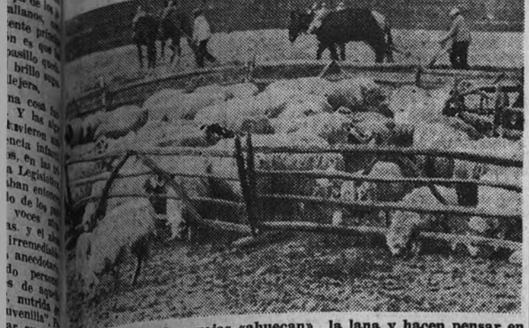
Esta época, las ovejas «ahuecan». la lana y hacen pensar en el esqueleto

Secretario general de la Dirección de Ganadería