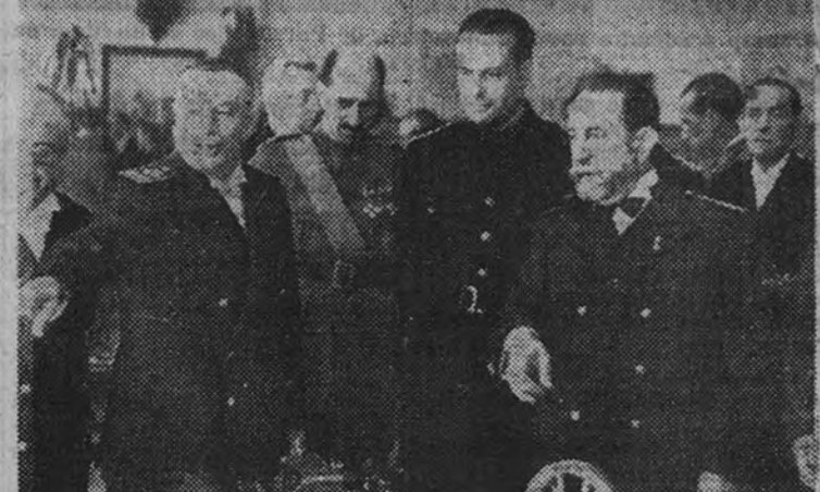
El Ministro de la Gobernación, durante su visita a las instalaciones

El camarada Blas Pérez anunció la inmediata publicación de la ley que reorganiza los Cuerpos de Correos y Telecomunicación