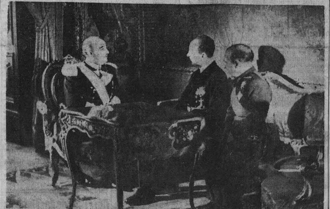
El Caudillo, acompañado del Ministro de Asuntos Exteriores, conversa con el embajador de Alemania en la presentación de cartas credenciales.