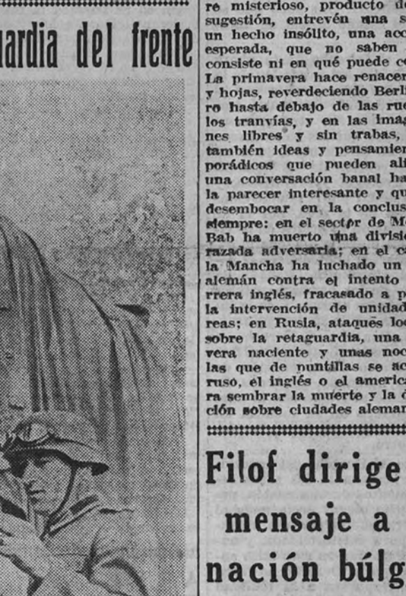
El jefe del Gobierno búlgaro, Filof, dirige un mensaje a la nación búlgara.