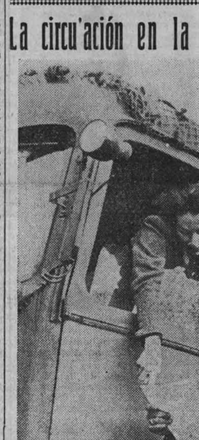
Una artista alemana, conductora del camión que conduce el equipaje de la compañía, pregunta a un soldado alemán la carretera que ha de seguir para llegar a la localidad más cercana.

DOS DE MAYO FIESTA DE LA INDEPENDENCIA. "SI" SUPLEMENTO DE ARRIBA. Exalta y recoge la gesta más española.