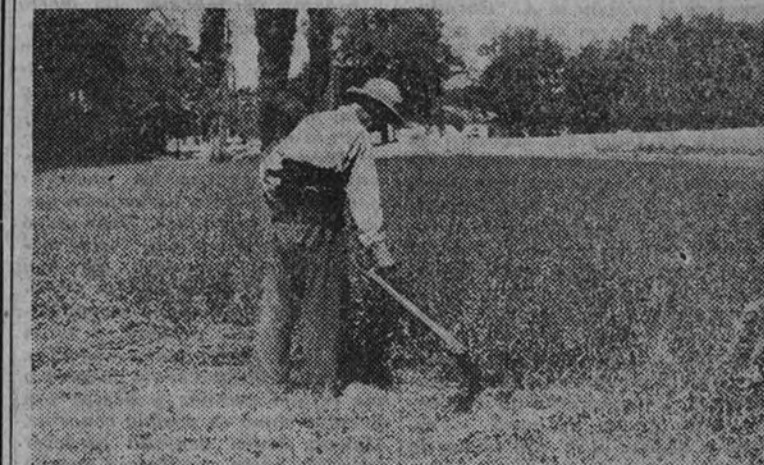
La espesa masa de forraje ha iniciado su floración. Es el momento de segar, de enterrar...