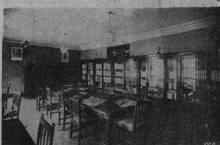
Detalle de la biblioteca del Hogar Universitario de Santiago de Compostela, recientemente inaugurada.

En cambio, el motivo por el cual hoy nos congregamos aquí tras de recibir el homenaje de una oración por el alma de nuestros mejores, éste sí que es un motivo digno de robar unos momentos al descanso o al trabajo, para hacer unas cuantas afirmaciones fundamenta-