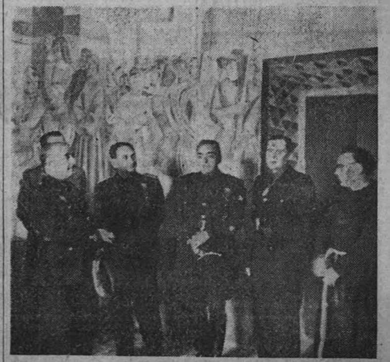
El Generalísimo, con el Ministro Secretario y otras personalidades, en el Monasterio de la Rábida.