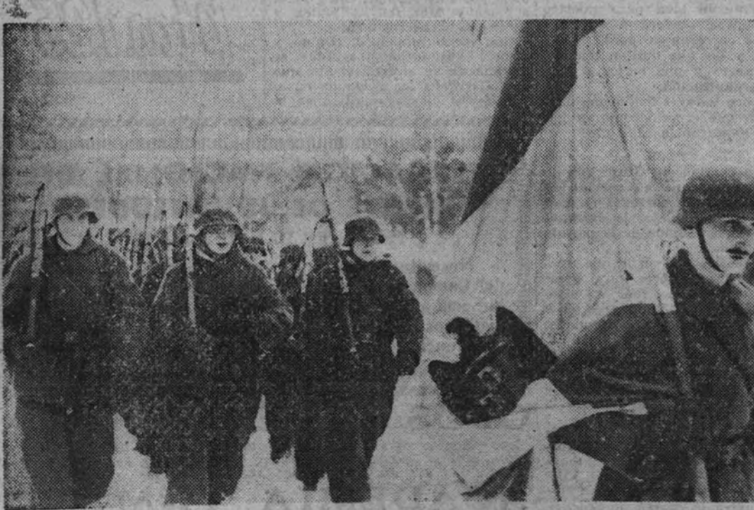
Precedidos por la bandera de honor, premio a sus hazañas, los camaradas de la División Azul desfilan ante sus jefes