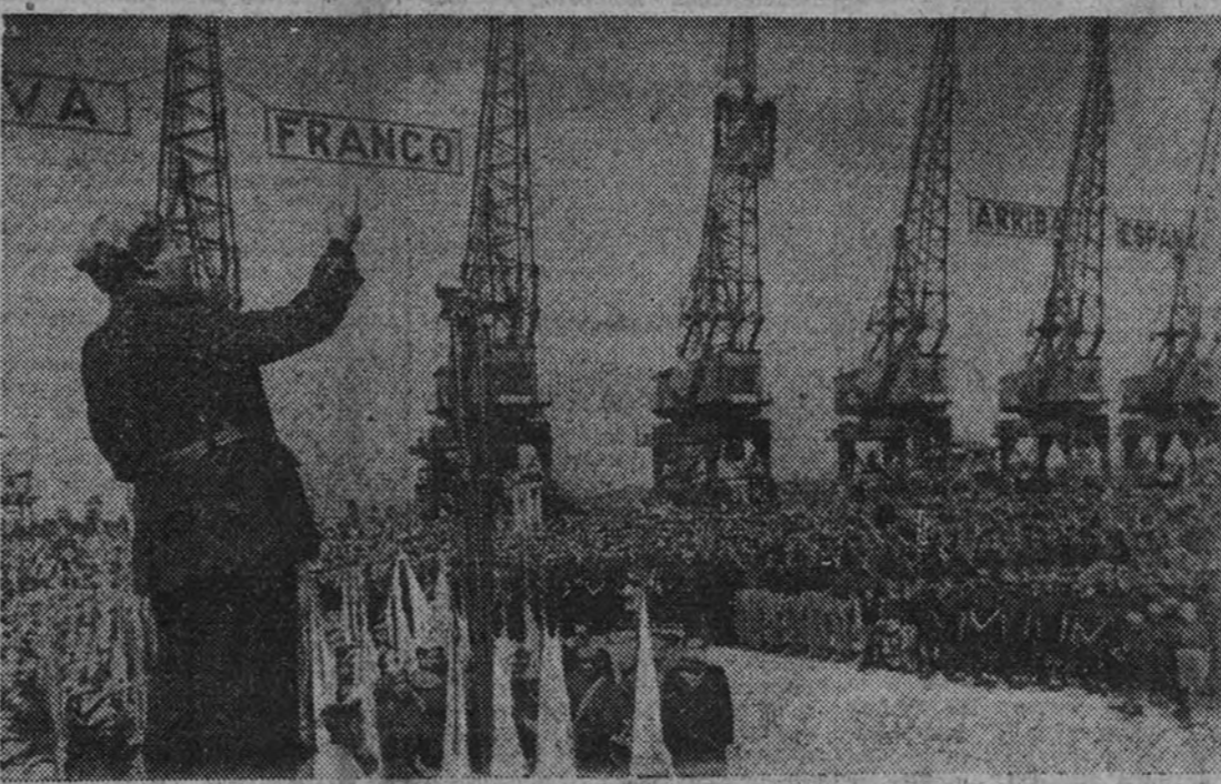
El Caudillo pronuncia su discurso ante el pueblo de Huelva congregado en el muelle. (Foto Contreras.)

Acto conmemorativo de la epopeya del Cid Campeador en Roma ROMA 5.—Un acto conmemorativo de la epopeya del Cid Campeador se ha celebrado en el teatro de la Fortuna, de la ciudad de Fano. Asistió el agregado de Prensa a la Embajada de España en el Quirinal, en representación del embajador, camarada Fernández Cuesta, y leyó unas cuartillas de éste sobre Rodrigo Díaz del Vivar. (Efe.)