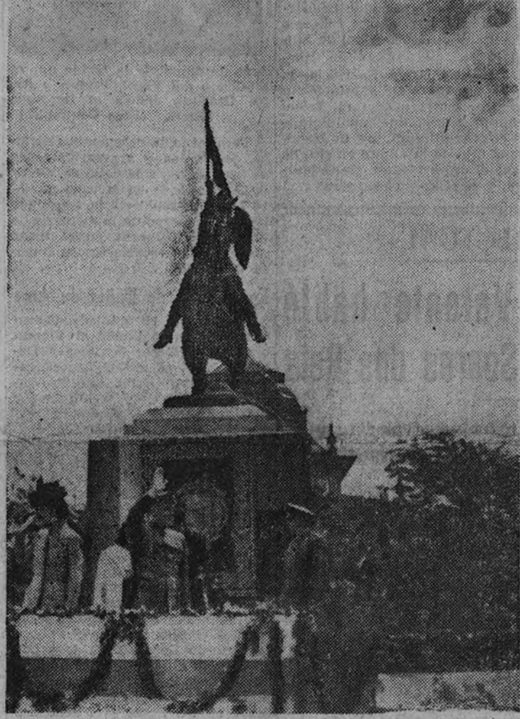
El Generalísimo saludando al público, que le aclamaba, a su llegada a la tribuna

SEVILLA 6.—Ha amanecido hoy un día frío y sin sol. Desde las primeras horas la ciudad tenía una fisonomía desusada y una animación extraordinaria. De los pueblos llegaban constantemente camiones abarrotados de camaradas de F. E. T. y de las J. O. N. S. para formar en la gran concentración y desfile que había de celebrarse ante Su Excelencia el Jefe del Estado.