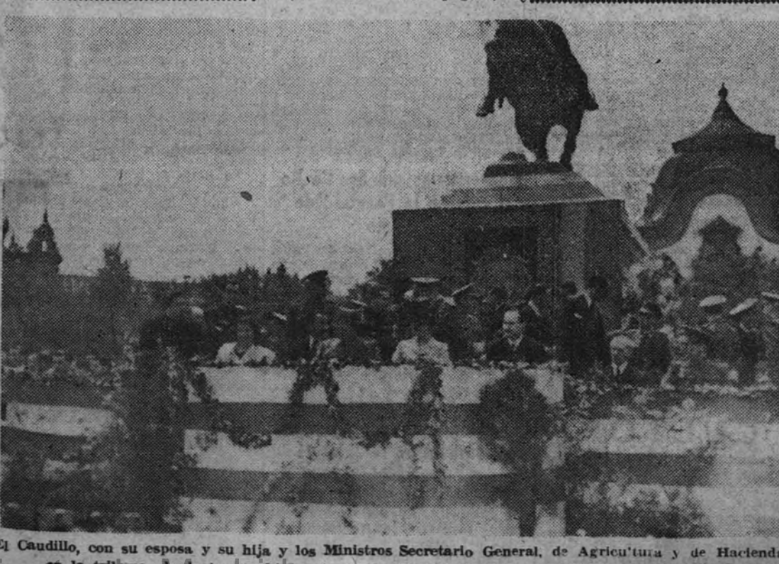
El Caudillo, con su esposa y su hija y los Ministros Secretario General, de Agricultura y de Hacienda, en la tribuna, desde la que hizo entrega de los premios a los ganadores de los concursos

Cuatro opiniones interesantísimas sobre lo que debe ser la Prensa juvenil. Leídas en «Centurias», órgano juvenil de Madrid.