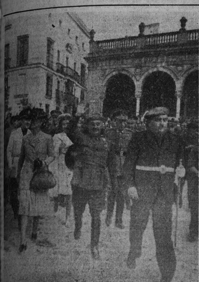
El Caudillo, acompañado de su esposa y de su hija, recorre a pie, entre las aclamaciones de la multitud, las calles de Jerez.