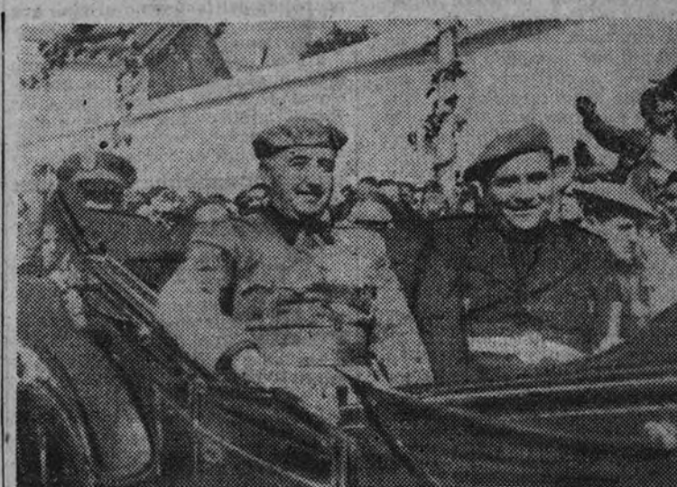
El Caudillo, acompañado del Alcalde de Jerez, en el momento de su llegada a la ciudad andaluza.

BUENOS AIRES 8.—La Prensa argentina continúa destacando el viaje de Franco a Andalucía y reproduce sus discursos. Destacan los diarios la afirmación del Caudillo de que España está alerta y decidida a defender a toda costa la seguridad e independencia de la nación. (Efe.)