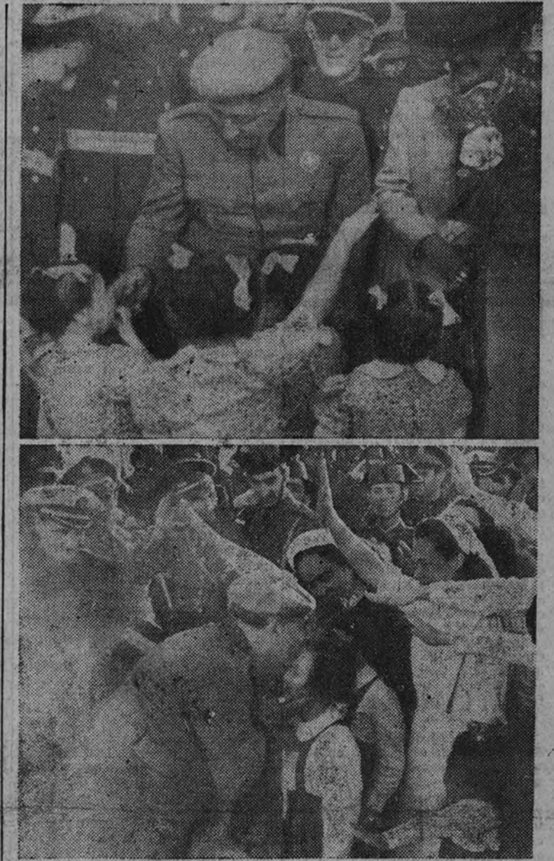
El Caudillo acariciando a las niñas acogidas en un Hogar de Auxilio Social en Granada. En la foto inferior Su Excelencia el Jefe del Estado besa a la hija de un pescador en Almería.