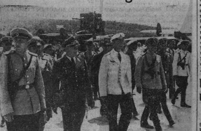
Con asistencia de representantes de las naciones amigas, se ha verificado en la costa búlgara la inauguración de una base aérea para defender el país de los ataques de la Aviación soviética.