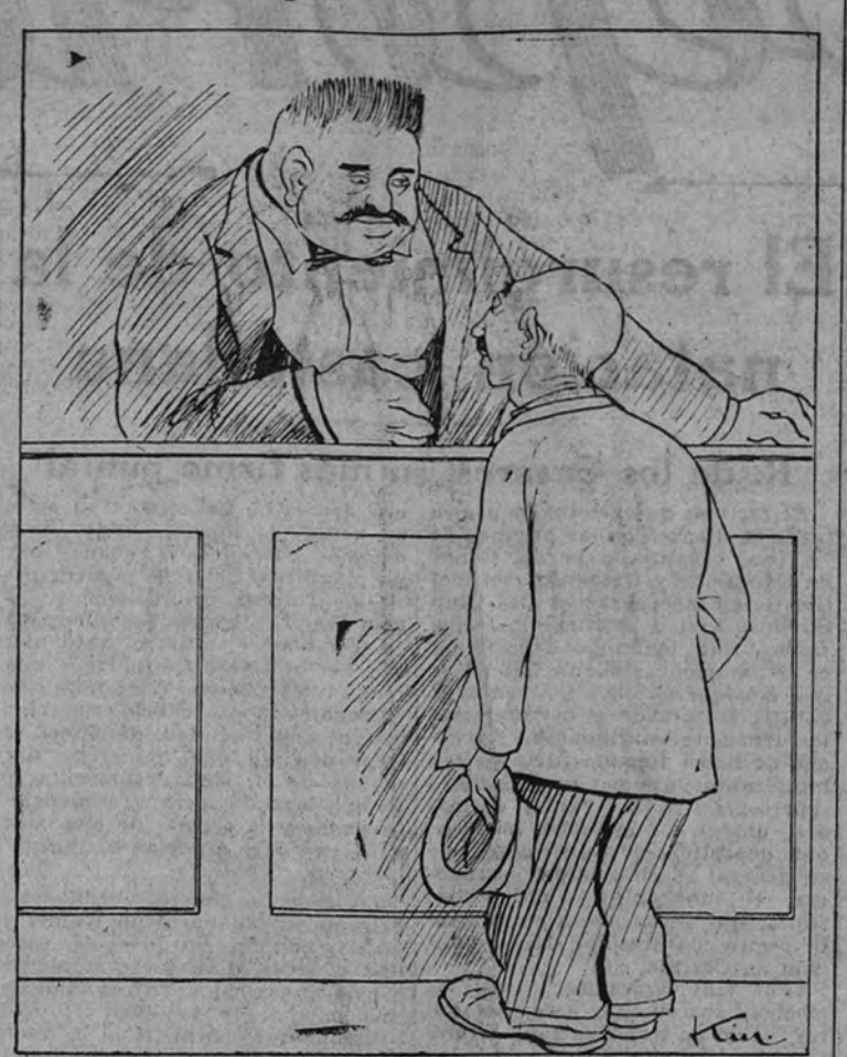
—Oiga, ¿es usted el jefe? —No, señor; yo soy el ordinario.