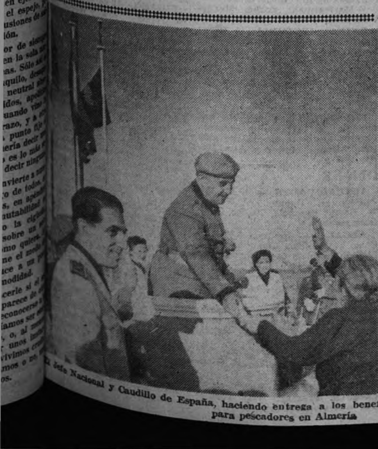
El Jefe del Estado y Caudillo de España, haciendo entrega a los beneficiarios de las llaves de las casas para pescadores en Almería.

De punta a cabo—de norte a sur—de la Patria ha paseado el Jefe del Estado, el Jefe del Movimiento, el Jefe de la Nación, como el adusto castellano y el reservado gallego han pasado del mismo modo jubiloso. ¿Qué le toca hoy a Madrid? El mismo número y cantidad las pruebas de su fe en el Caudillo? La España que está obligada a darle la más plena y personal expresión a este homenaje del pueblo español—de las provincias españolas—a Franco. Madrid entero debe hoy volcar su espíritu en la causa que para testimoniar a Francisco Franco la absoluta fe del pueblo español, que por su política firme y generosa se ha hecho grandeza de España.